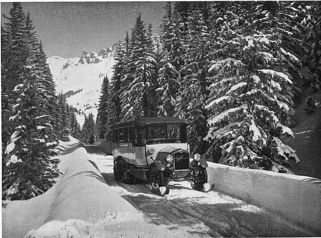
Raufenbandwagen im verschneiten Hochwald bei Lenzerheide Autochenille dans la forêt neigeuse aux environs de Lenzerheide