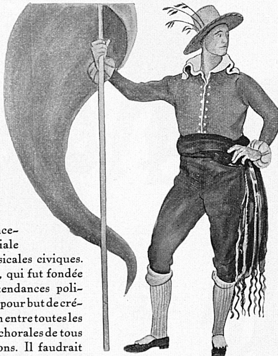
Les personnages du Festival

D'après les maquettes d'Ernest Bieler, artiste peintre