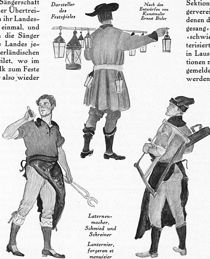
Laternen- macher, Schmied und Schreiner