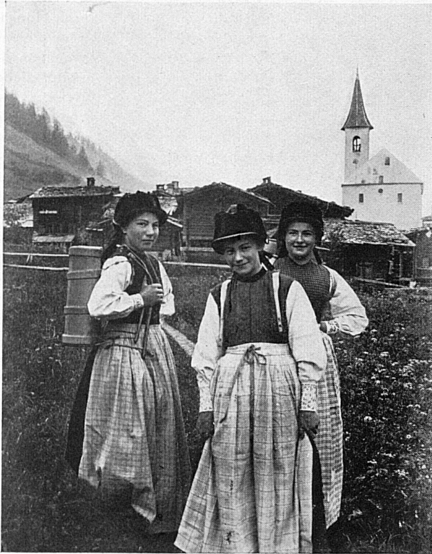
Im Lötschental / Dans la vallée de Latschen

Un tel effort, de si louables sacrifices, méritent certes la reconnaissance des autorités et du public, et il faut espérer que les foules accourront de tout le canton et