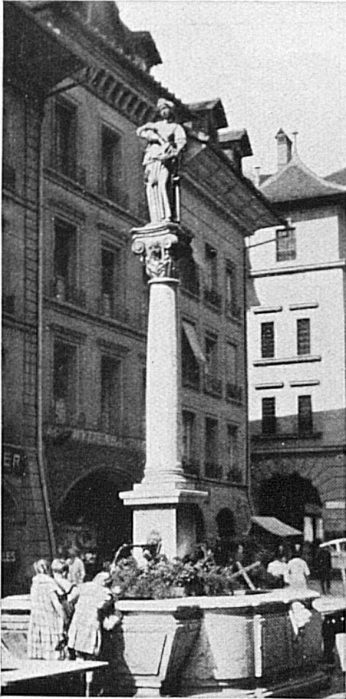
Der Anna Seiler-Brunnen in der Marktgasse La fontaine d'Anna Seiler à la rue du Marché

Schaufenstern, die unter ihnen errichtet wurden, modernes Leben.