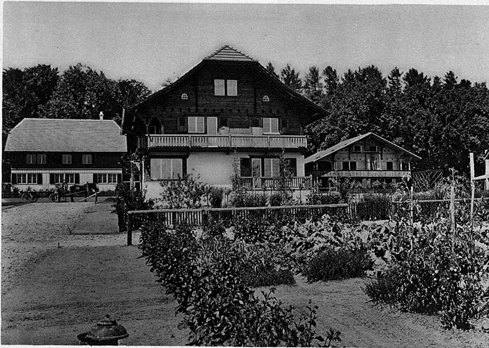
Das Chalet des Schweizerischen Nationalvereins der Freundinnen junger Mädchen Le chalet de l'Union suisse des amies de la jeune fille / Chalet dell'Unione svizzera della protezione della giovane