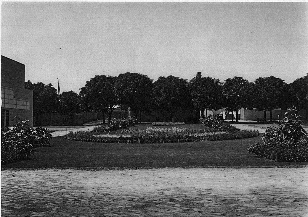
Die Anlage des Schweizerischen Gärtnerinnenvereins / L'exposition de la Société d'horticulture des femmes suisses Culture floreali della Società delle giardiniere svizzere