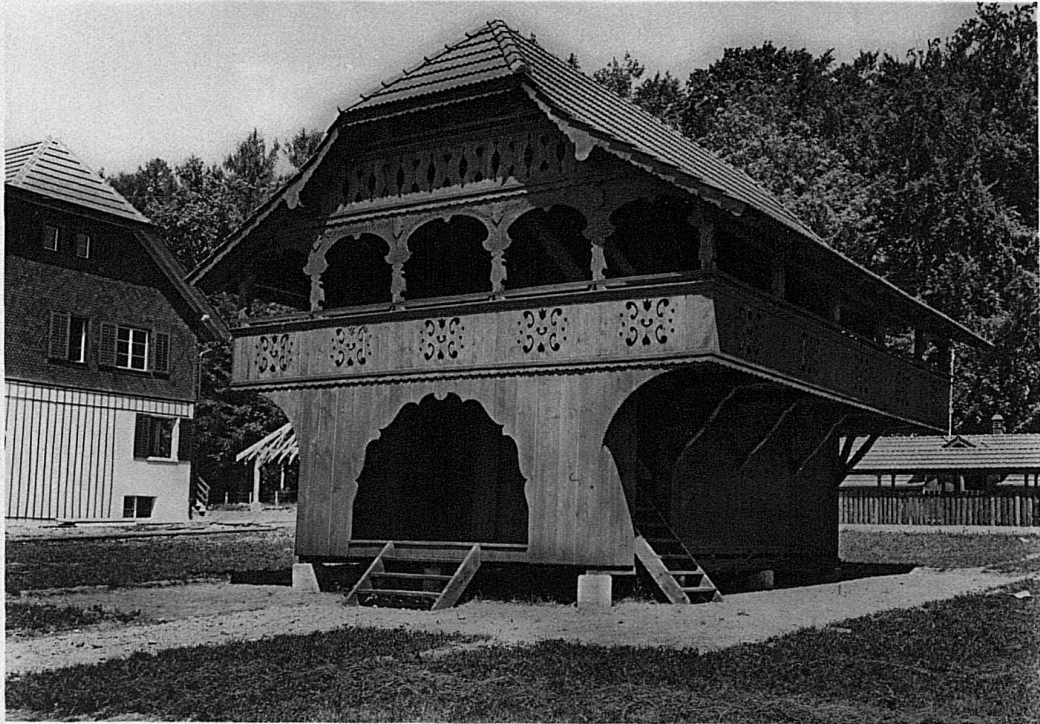
Der Speicher aus dem Emmental / Chalet aux provisions dans l'Emmental / Granaio dell'Emmental