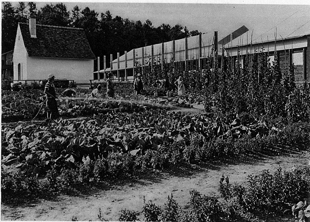
Im Pflanzplatz und Schrebergarten / Le jardin potager modèle / Orto modello