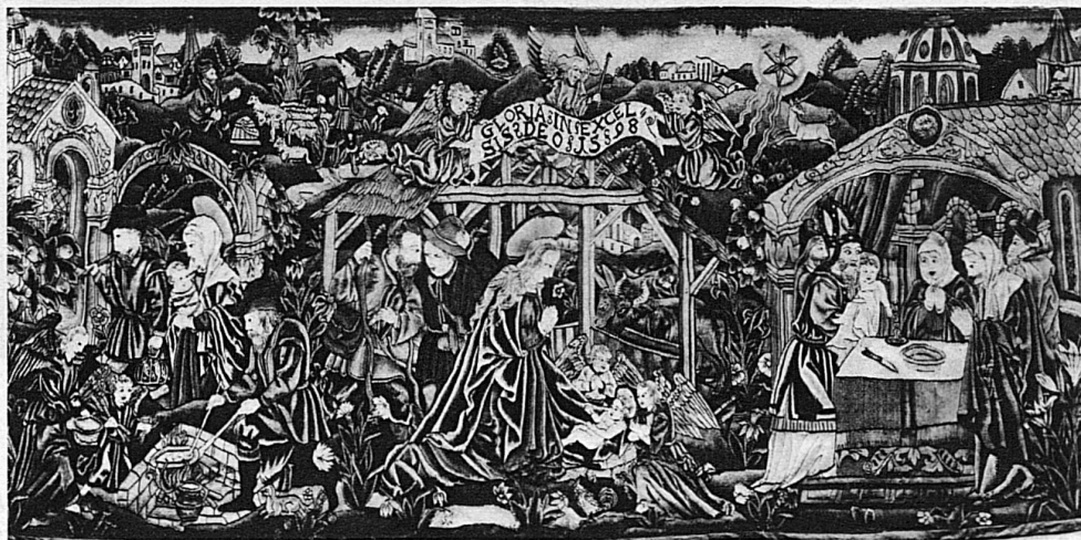
Antependium aus dem Kloster St. Anna im Bruch bei Luzern, 1598 / Antependium du couvent de Ste-Anne aux environs de Lucerne, 1598 Antependium del monastero di St. Anna a Bruch presso Lucerna, 1598