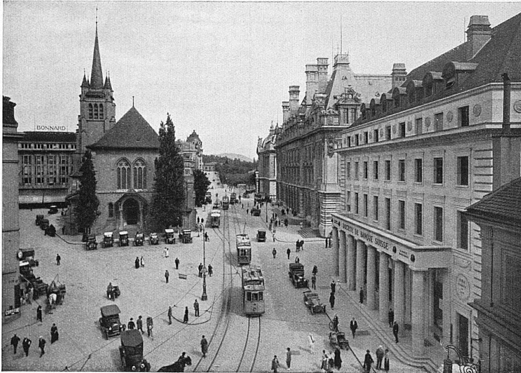
Lausanne, Place St-François