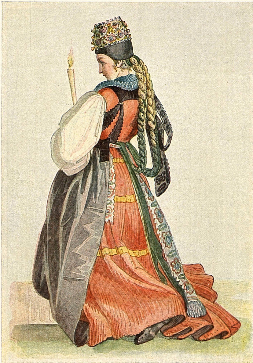
Wirtstochter zu Plaffeien 1816 im Brautkleid der Deutsch-Freiburger Tracht Fille d'aubergiste de Planfayon en robe de mariée. Costume de la partie allemande du canton de Fribourg en 1816

Aus dem Werk: «Die Volkstrachten der Schweiz» von Julie Heierli Verlag Eugen Rentsch, Erlenbach-Zürich