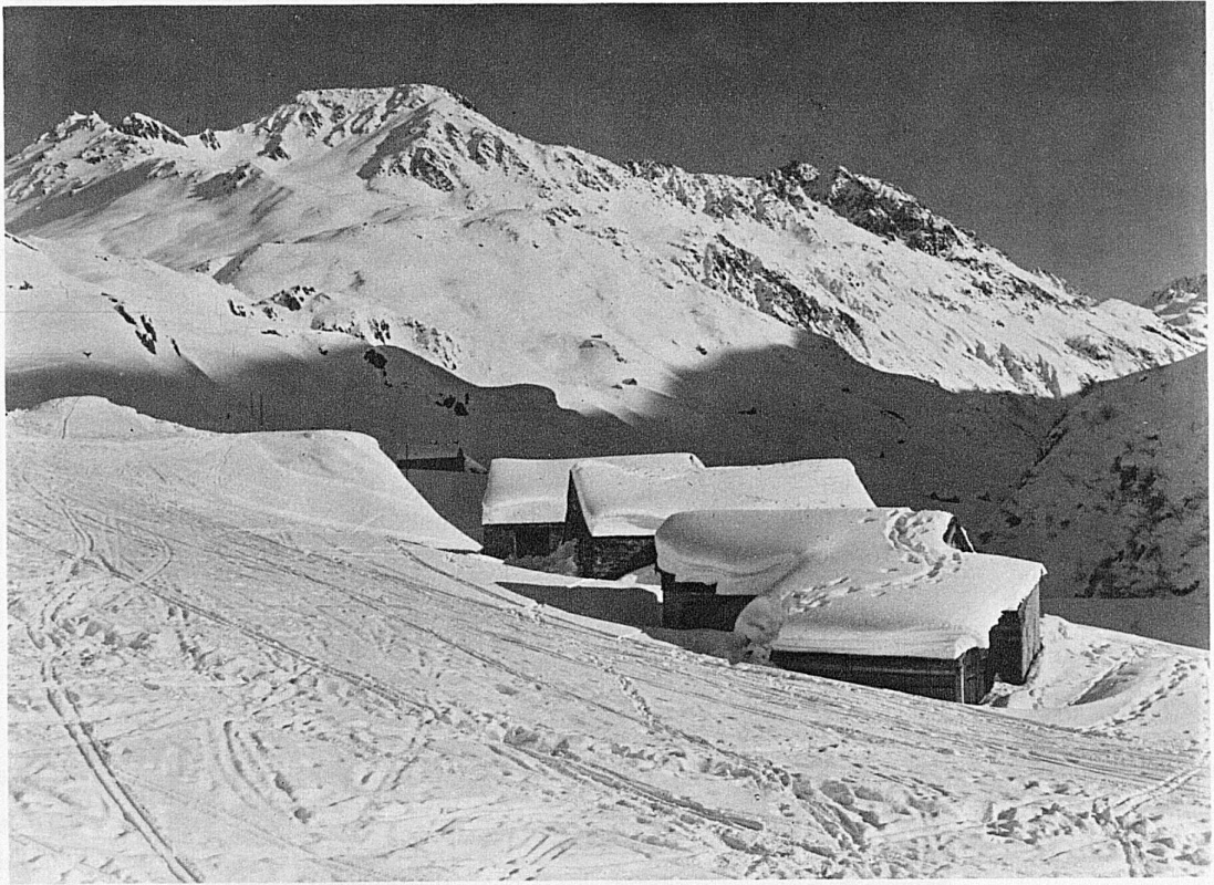
Hütten bei Andermatt / Huttes aux environs d'Andermatt / Huts near Andermatt / Cascine nei pressi di Andermatt