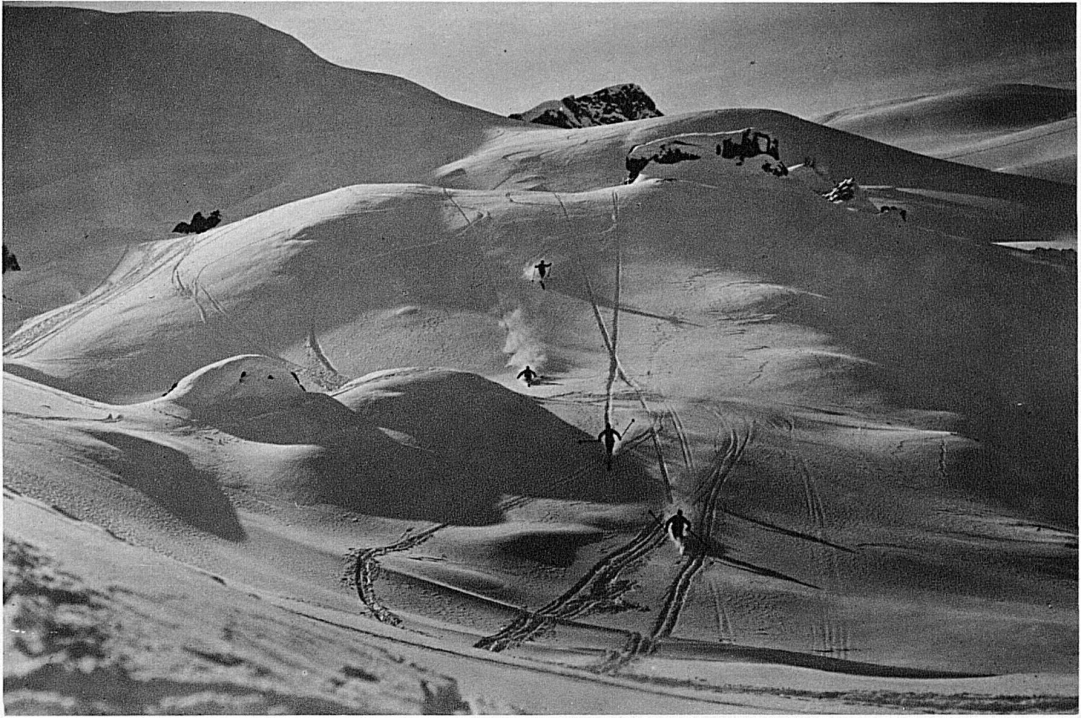
Skigelände bei Adelboden / Pistes de ski près d'Adelboden / Ski fields at Adelboden Campi di neve per skiatori presso Adelboden