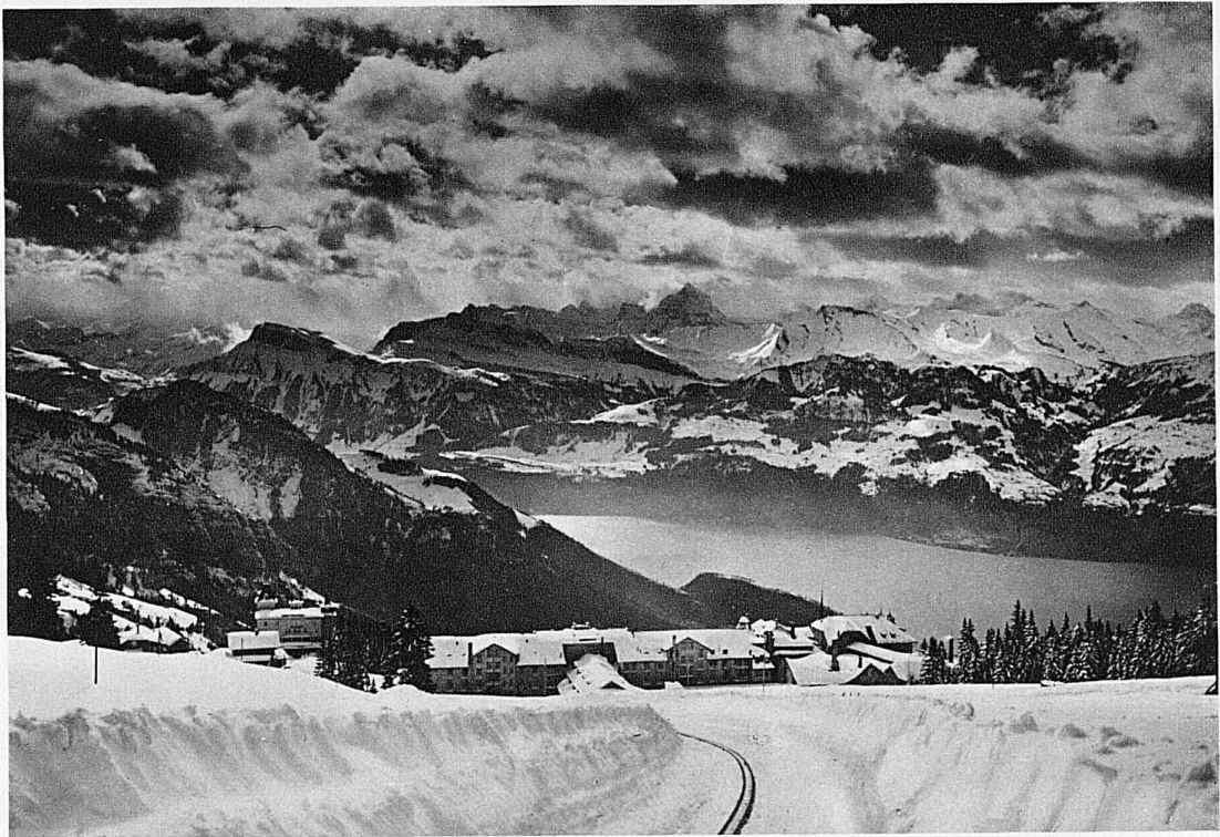
Drohender Sturm / Menace de tempête / A Threatening Storm / Tempesta imminente