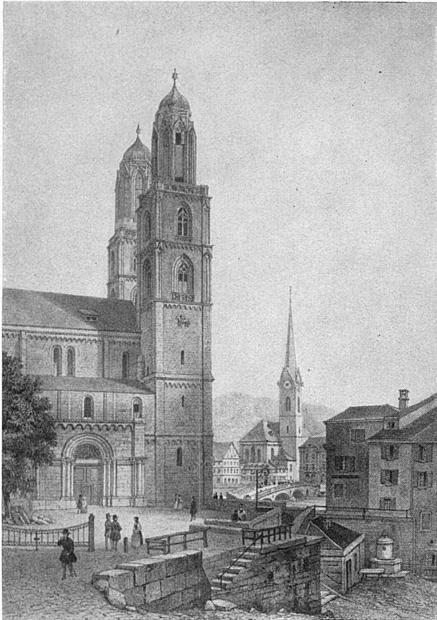
Das Grossmünster in Zürich Gez. von Deroy