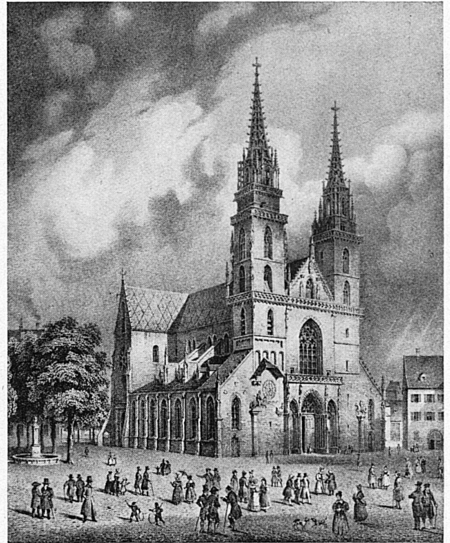
Das Münster in Basel / La cathédrale de Bâle J. Rothmüller, d'après Guise

er trifft, bis auf jene durch die üblichen deutschen Sonderbestrebungen herbeigeführten Eigenarten, die heimatlichen Kunstformen, und so ist auch der Italiener in Lugano und Locarno wie zu Hause, und der Franzose in Genf, Lausanne und Freiburg. Wenn diese drei Nationen trotz aller Betonung ihrer kulturellen Eigentümlichkeiten und der nie geleugneten ethnologischen Zusammengehörigkeit mit der grossen Stammnation, dennoch keine wesentlichen Lostrennungsgelüste zeigen, so mag man daraus sehen, wie stark die innerstaatliche Bindung ist, die hier ein so hohes Gefühl von Sicherheit und Wohlgefühl erzeugt. Dabei muss man auch noch berücksichtigen, was auch bei der Wertung der Kunstdenkmäler nicht ausser acht gelassen werden darf, dass die Schweiz eigentlich ein neuzeitliches Staatsgebilde ist, denn ganz abgesehen von der erst in der Mitte des verflossenen Jahrhunderts vollkommen geänderten innern Staatsform, sind wichtige Kantone, wie Tessin und Waadt, erst im XVI. und Genf gar erst zu Beginn des XIX. Jahrhunderts eingegliedert worden.