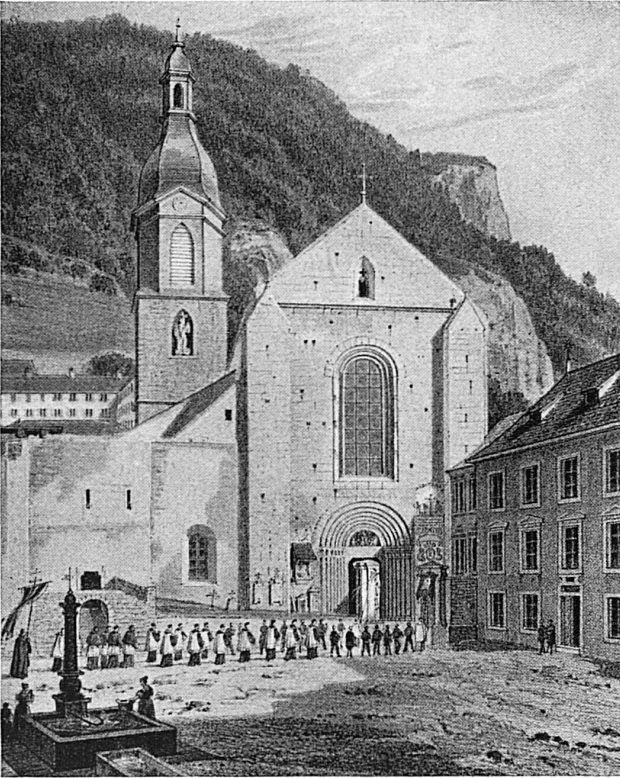
Der Dom in Chur / Le dôme de Coire