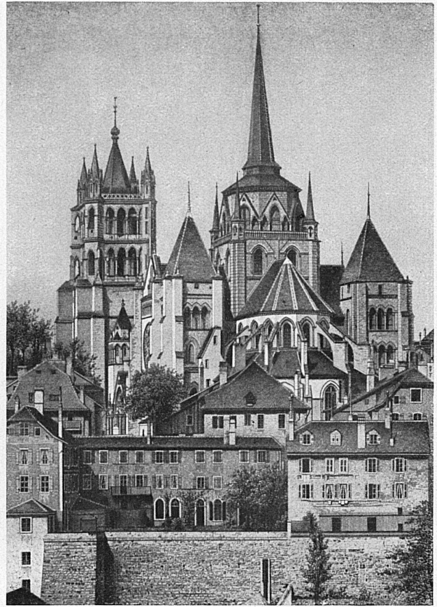
Die Kathedrale in Lausanne