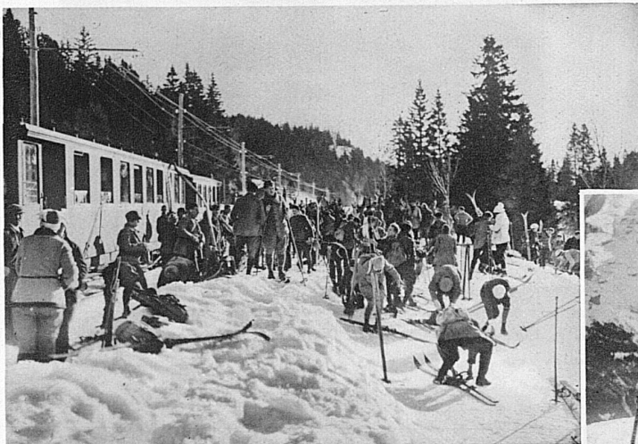
Sportbetrieb auf der Nyon-St-Cergue-Bahn / Le chemin de fer Nyon- St-Cergue au service des sports / Sport traffic on the railway between Nyon and St-Cergue / Movimento sportivo sulla ferrovia Nyon-St-Cergue