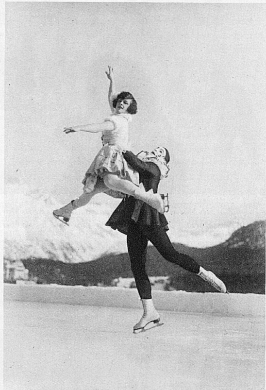
Die Seen Graubündens in spiegelnder Glätte / Les lacs des Grisons dorment sous leur miroir de glace The lakes of the Grison, smooth as a mirror / I laghi grigionesi tersi specchi di ghiaccio