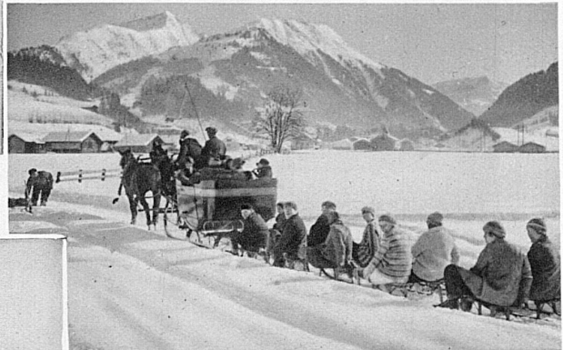
Freiluft-Jazzband in Mürren / Jazz-band en plein air à Mürren / A Jazz band in the open air at Murren Jazzband all'aperto a Mürren

Fröhliches Schlittervolk in Gstaad / Joyeuse partie de luges à Gstaad / Cheerful skaters at Gstaad / Partita di slitte a Gstaad