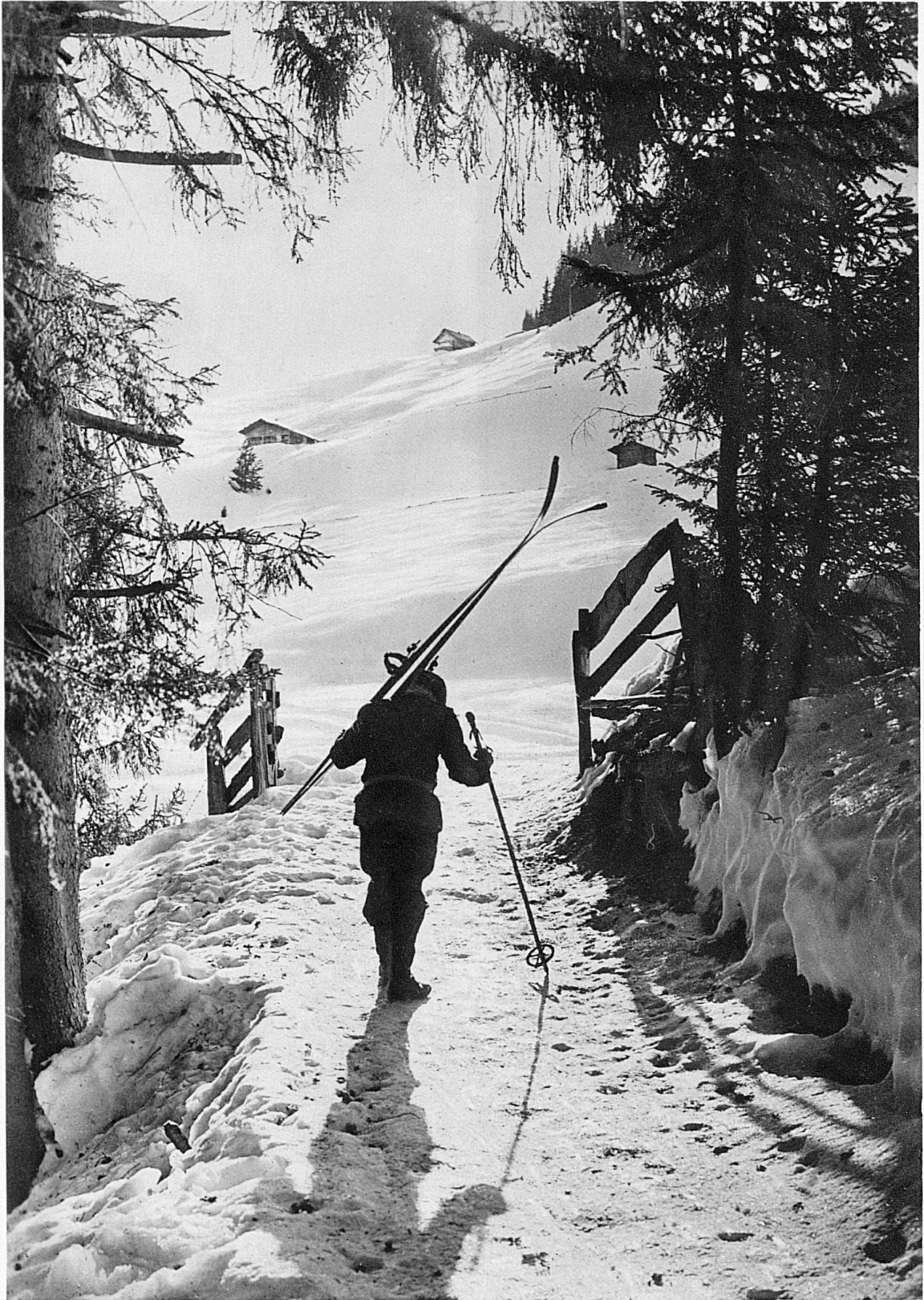
Hinauf in die schneeige Pracht der Berge / En route pour les blanches cimes Off to the Mountains and their snowy splendour / Più in alto, sulle magnifiche cime nevose