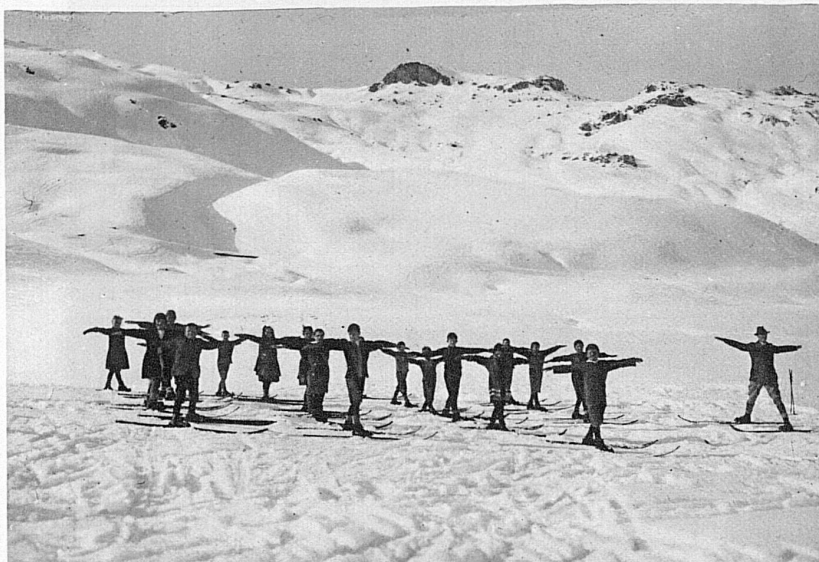
Skiturnen in St. Moritz / Gymnastique sur skis à St-Moritz Display of Ski-ing at St-Moritz / Skiatori-ginnasti a St. Moritz