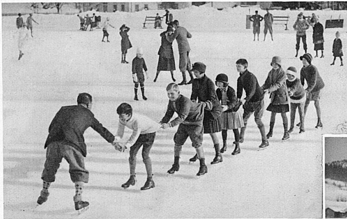
Muntere Jugend in Sils Maria / Jeunesse prenant ses ébats à Sils Maria Gay youth in Sils Maria / Allegra comitiva giovanile a Sils Maria