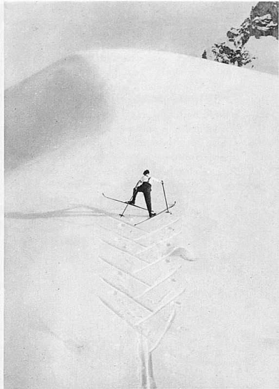
Skifreuden und Wintersonne bei Adelboden / Environs d'Adelboden: Plaisirs du ski au grand soleil Skiing in the winter sunshine of Adelboden / Nella regione d'Adelboden inondata di sole invernale