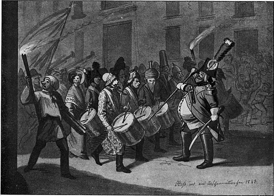
Der Morgenstreich in Basel / Ein berühmtes Bild von Hieronymus Hess, 1843