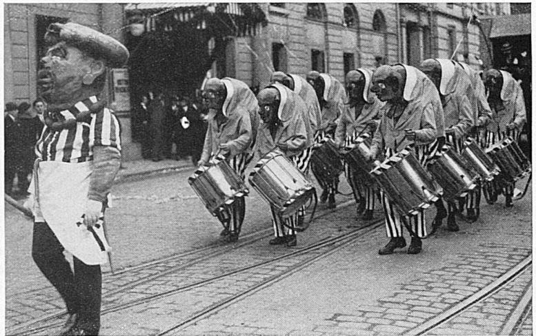
Clique. Tambours costumés

Tandis que, dans les campagnes, ces manifestations tiraient généralement leur origine du vieux paganisme germanique, dans les villes, au contraire, les cortèges et les masques apparus relativement tard (au courant du XVI e siècle), se rattachent plutôt à la tradition romaine des Saturnales, avec le renversement passager des relations sociales. Il n'y a plus ni maîtres, ni serviteurs, ni enfants, ni parents: sous le masque, chacun fait ce que bon lui semble. Les plaisanteries, au temps jadis, allaient assez loin. Combien de fois de graves bourgeois se voyaient-ils arrachés aux douceurs du sommeil ou à la béatitude de la digestion pour achever leur soirée au fond d'un bassin de fontaine, tandis que des troupes d'enfants hardis et voraces faisaient main basse sur les apprêts de la cuisine! Mais, avec le temps, les mœurs se sont adoucies. Sans doute, les besoins essentiels demeurent: manger, danser et boire. On y met toutefois un peu plus de formes. Chacun y ajoute au gré de sa fantaisie ou de son tempérament. Les Bâlois d'aujourd'hui donnent toujours libre cours à leur esprit caustique, au son des tambours et des fifres. Avec leur goût de la mise en scène et du plaisir, les Lucernois renouvellent les cortèges sous la conduite du frère Fritschi et d'un « Fritschivater » (générale-