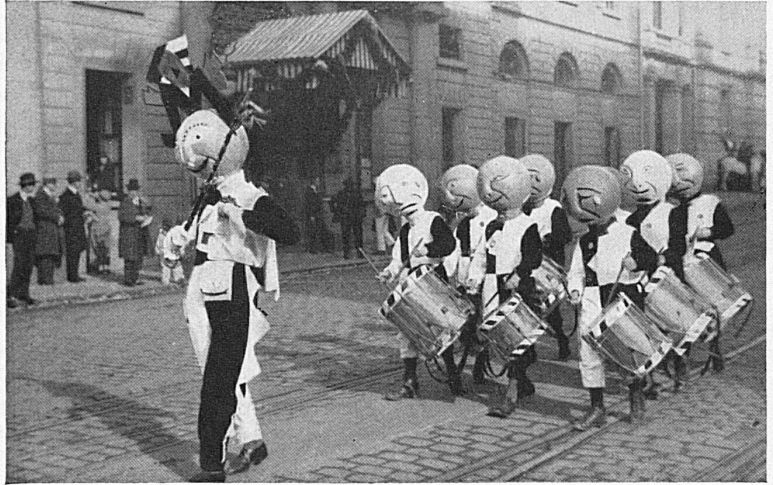
Jeunes tambours masqués / Knabenclique

La grande festività riprende in tutta la sua intensità il mercoledì mattina. Un recente tentativo da ripetere la « diana », il mercoledì, non fu coronato da successo e, almeno per qualche anno, il pubblico basileese non sarà più destato (forse a malincuore) al canto del gallo. Ma, la sera trionferà ovunque Tersicore, ed il giovedì mattina, a chi parte da Basilea coi primi treni sarà dato di assistere nei ristoranti e negli atrii della stazione, non alla solita musoneria imposta dagli affari e dalle preoccupazioni, ma alla gaiezza più sincera, spontanea, espressiva, che Pirandello direbbe dell' « io numero uno ».