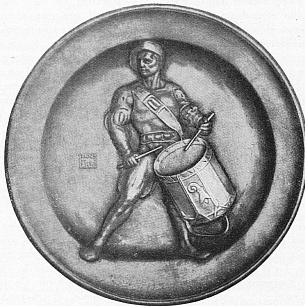
Basler Trommler. Zinnteller-Sujet von Hans Frey, Medailleur, Basel Tambour bâlois. Plat d'étain, œuvre du médailleur H. Frey, Bâle

ment un homme en vue et fortuné, il change chaque année) qui fait des largesses au peuple; ils multiplient les bals masqués, où seules les femmes portent costume et masque. Plus attachés à leur fête traditionnelle du Sechseläuten, qu'au carnaval proprement dit, les Zurichois s'efforcent de rivaliser, à leur manière, avec Bâle et Lucerne. Leur Fastnachtsgesellschaft cherche à relever le ton de ces manifestations en stimulant le goût et l'esprit d'invention pour les costumes et le choix des sujets, sans oublier les devoirs envers la bienfaisance. C'est là, du reste, une tendance qui se manifeste dans d'autres villes suisses également, où le