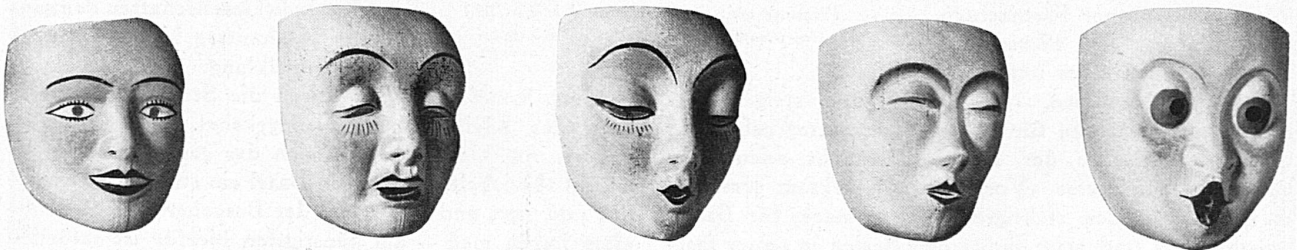
Baslerische Larvenmodelle von Bildhauer Max Varin / Modèles de masques bâlois, par Max Varin, sculpteur

Fast so berühmt wie das Trommeln sind die Basler Maskenbälle . In allen grösseren Lokalitäten werden sie am Montag und Mittwoch von 8 Uhr abends bis 4 Uhr morgens abgehalten. Die vornehmsten Bälle finden im Stadtkasino statt, veranstaltet vom Verein Quodlibet (am Montag) und von der Basler Casinogesellschaft (am Mittwoch), und man darf wohl sagen, dass «tout Bäle» daran teilnimmt. Ob sich der Ballbesucher nun unter den Tanzlustigen und Tanzfreudigen befindet, oder ob er von hohem Balkon herab sich das bunte Treiben ansieht, er wird auf seine Rechnung kommen und sich an dem ungemein farbenfrohen Bilde erfreuen. Künstlerhände haben die Dekorationen besorgt, Künstlerhände wiederum haben die apartesten und elegantesten Kostüme entworfen, und es steht der Jury eine schwere Aufgabe bevor, unter den Hunderten von originellen Einfällen die richtigen auszuzeichnen und zu prämiieren. In eifrigen Wettbewerb mit den Kasinobällen treten die Maskenbälle der Mustermesse, deren prächtige Räumlichkeiten