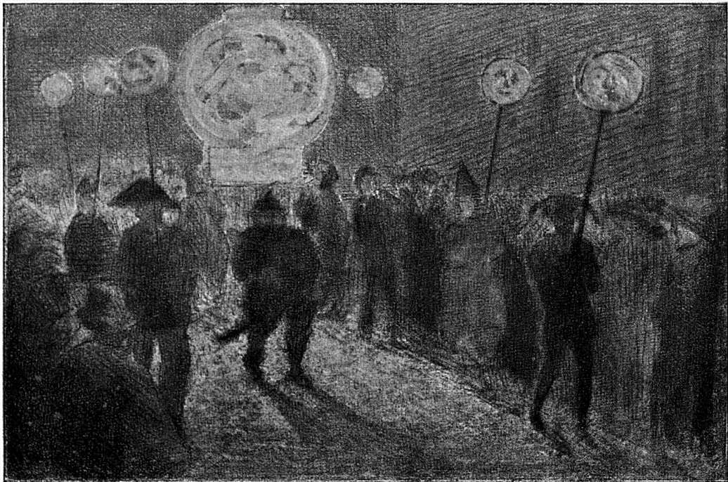
Laternen am Morgenstreich Von Arthur Riedel