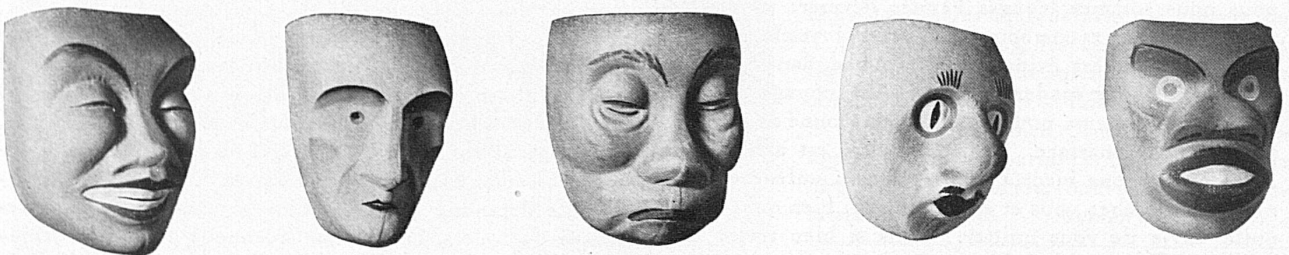
Baslerische Larvenmodelle von Bildhauer Max Varin / Modèles de masques bâlois, par Max Varin, sculpteur