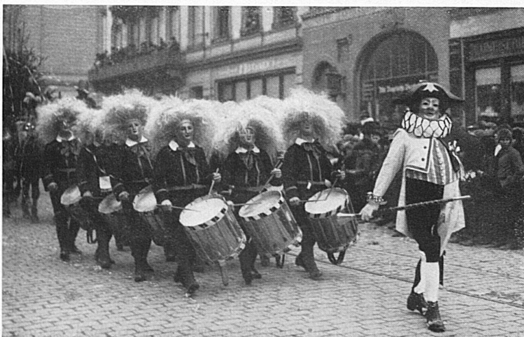
Clique. Tambours costumés

En 1928, le carnaval sera célébré dans nos villes et dans nos campagnes. Qu'en adviendra-t-il avec le temps? Nul ne saurait le dire aujourd'hui. Mais on ne peut s'empêcher d'observer que, peu à peu, les fêtes cantonales et fédérales, le cinéma, la T. S. F., le dancing, les festivals et les cortèges historiques ébranlent son empire et cherchent à l'éclipser. Mais quoi qu'il arrive, le souvenir du Prince Carnaval demeurera longtemps encore parmi les hommes, paré de la grâce de la jeunesse, tout séduisant de fantaisie et de gaité. Aymon de Mestral.