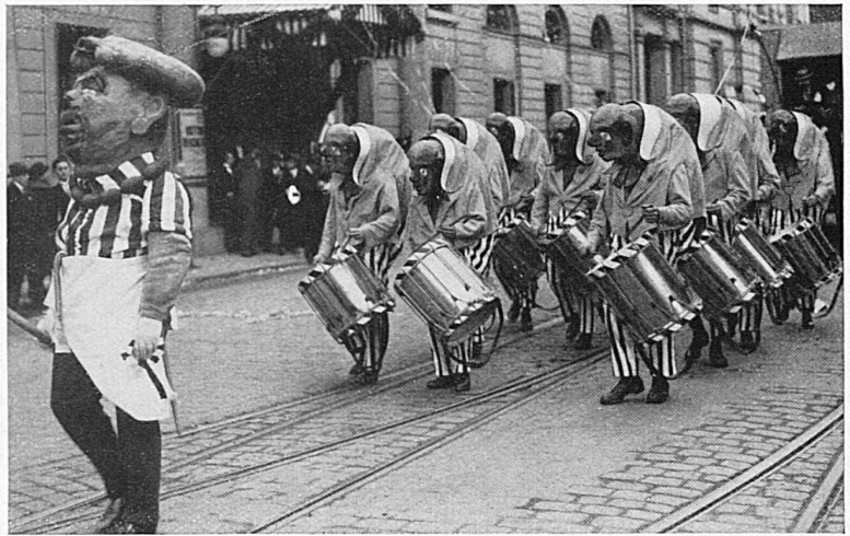
Clique. Tambours costumés

Tandis que, dans les campagnes, ces manifestations tiraient généralement leur origine du vieux paganisme germanique, dans les villes, au contraire, les cortèges et les masques apparus relativement tard (au courant du XVI e siècle), se rattachent plutôt à la tradition romaine des Saturnales, avec le renversement passager des relations sociales. Il n'y a plus ni maîtres, ni serviteurs, ni enfants, ni parents: sous le masque, chacun fait ce que bon lui semble. Les plaisanteries, au temps jadis, allaient assez loin. Combien de fois de graves bourgeois se voyaient-ils arrachés aux douceurs du sommeil ou à la béatitude de la digestion pour achever leur soirée au fond d'un bassin de fontaine, tandis que des troupes d'enfants hardis et voraces faisaient main basse sur les apprêts de la cuisine! Mais, avec le temps, les mœurs se sont adoucies. Sans doute, les besoins essentiels demeurent: manger, danser et boire. On y met toutefois un peu plus de formes. Chacun y ajoute au gré de sa fantaisie ou de son tempérament. Les Bâlois d'aujourd'hui donnent toujours libre cours à leur esprit caustique, au son des tambours et des fifres. Avec leur goût de la mise en scène et du plaisir, les Lucernois renouvellent les cortèges sous la conduite du frère Fritschi et d'un « Fritschivater » (générale-