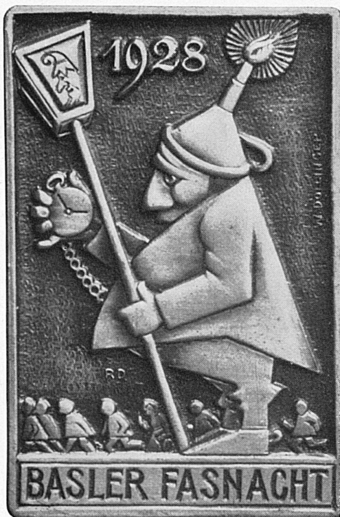
Offizielle Basler Fastnachts-Plakette 1928

Kurz nach 2 Uhr nachmittags versammeln sich die Zugsteilnehmer in ihren Lokalen, da werden die nötigen Requisiten bereitgestellt, die Wagen kommen angefahren, der ganze Fastnachtszug wird formiert, jeder Teilnehmer nunmehr in der zu dem ausgespielten Sujet passenden Kostümierung, der Tambourmajor, als wichtigste Persönlichkeit, gibt das Zeichen zum Abmarsch, und so ziehen nun die einzelnen Gesellschaften den ganzen Nachmittag hindurch, unter Trommelklang und Piccolobegleitung, kreuz und quer durch die Stadt, vom Grossbasel ins Kleinbasel, und umgekehrt. Im Gegensatz zu den sog. Umzügen, wo sich das ganze Bild korsomässig abwickelt, herrscht in Basel ein ständiges Gewoge hin und her, und wo immer der Besucher seinen Standplatz haben mag — am günstigsten hierfür ist natürlich das Stadtzentrum zwischen mittlerer Rheinbrücke und