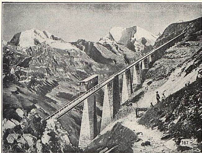
SEILBAHN NIESEN, Berner Oberland. Totale Länge 3496 m. überwundene Höhe 1645 m. Maximalsteigung 68%.

Walzwerke, Schmiede, Gießereien, Elektrostahlwerk, mech. Werkstätten