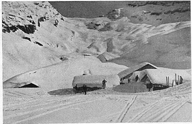
Skifelder bei den Wunderquellen von Leukerbad Loèche-les-Bains, célèbre station balnéaire, n'est pas moins recherchée par les skieurs

tout cela composait une atmosphère de sérénité mystérieuse que les soucis de la plaine, les rappels de la vie bruyante étaient impuissants à troubler.