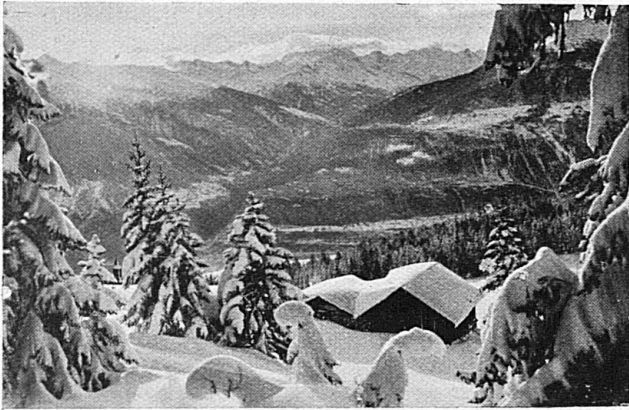
Das aussichtsreiche Sportplateau von Montana Le plateau de Montana réputé par ses sports et sa vue