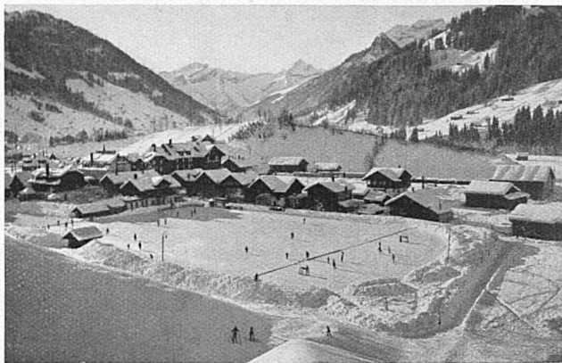
Ein prächtiges Eisfeld in Gstaad Magnifique patinoire à Gstaad