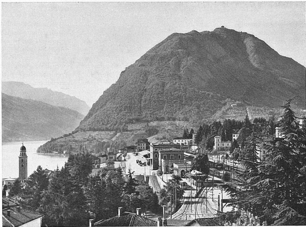
Bahnhof Lugano mit Monte S. Salvatore / La gare de Lugano et le Monte S. Salvatore