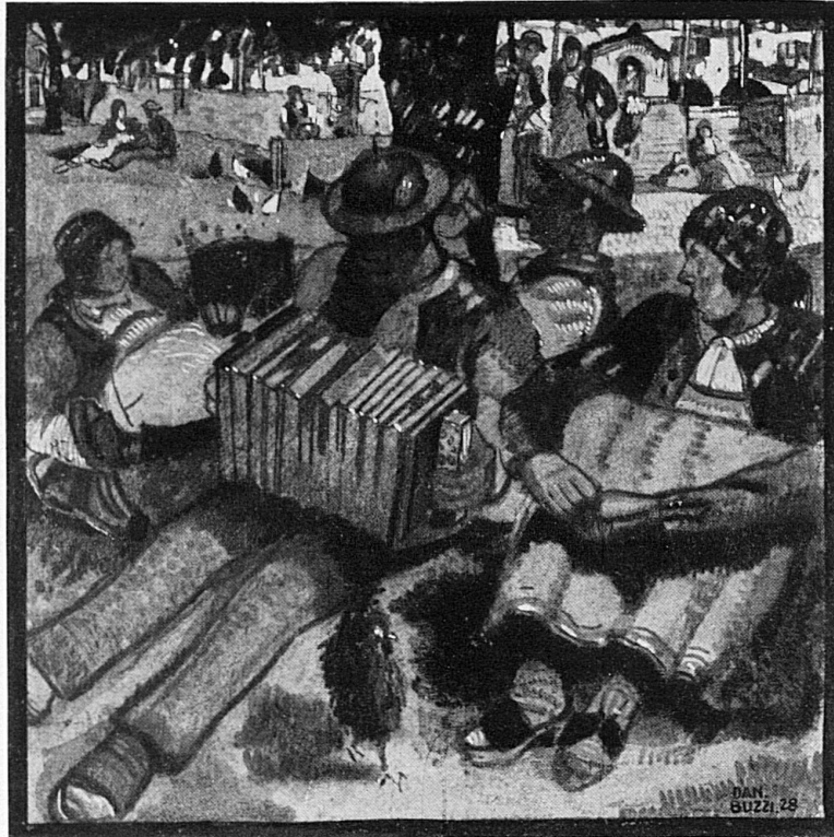
Sonntagsruhe im Tessin / Repos dominical au Tessin / Svago domenicale