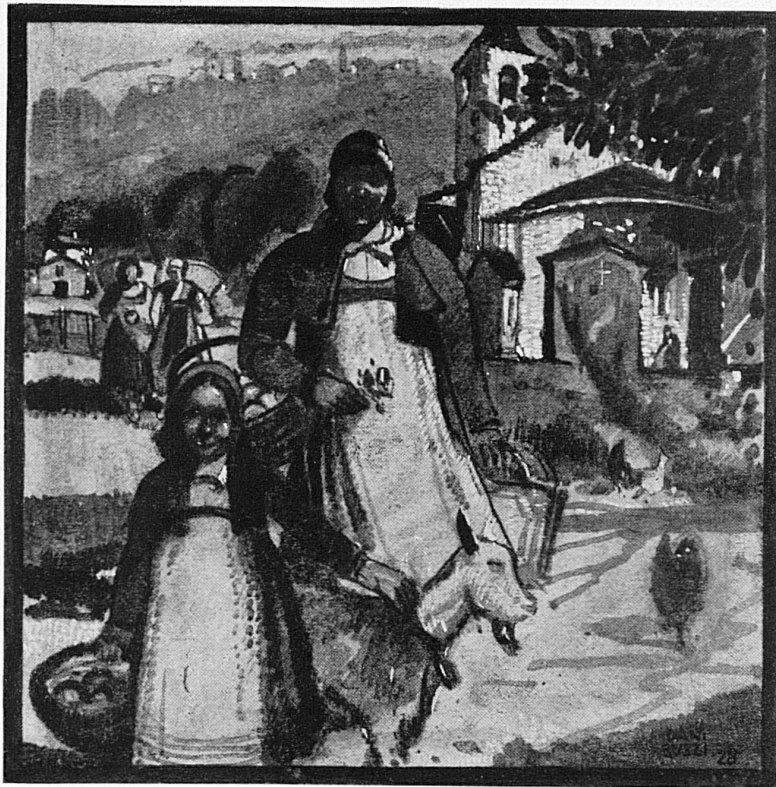
Auf dem Wege zum Markt / En route pour le marché / Paesane Ticinesi

des Festes das Festspiel. In seinen grossen Zügen wiederholt es sich, wenn es auch jedes Jahr im einzelnen, namentlich im Gange der Handlung, Überraschungen bringt. Einmal hat man den Versuch gemacht, eine Art Oper mit richtiger Theaterdekoration, echten Schauspielern und Mailänder Ballettinnen aufzuführen. Da stellte sich heraus, dass die einheimischen Dichter und Komponisten bessere Fabeln und Musik erfunden hatten als ihre grossstädtischen Kollegen von Namen, und dass die Locarneser Dilettanten stärker ans Herz rührten als die raffiniertesten auswärtigen Büh-