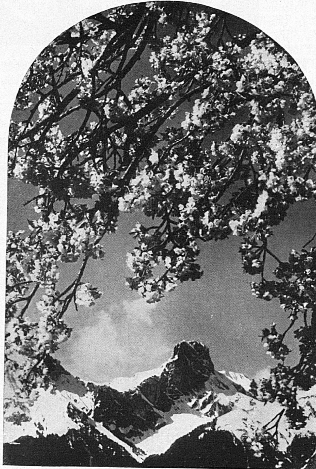
Féerie printanière à Thoune Blütenzauber bei Thun

In alcune parti questo culto è un po' meno intenso. Si tratta di popolazioni povere, costrette ad un certo