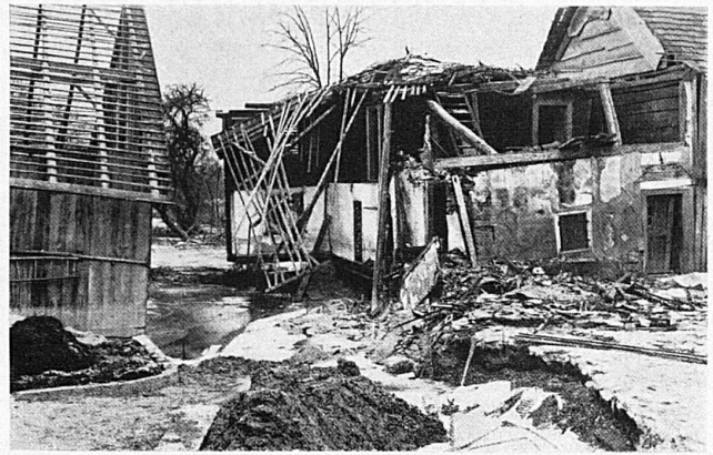
Hier gibt es zu helfen / Où le secours est de toute nécessité

einem Ingenieur, einem Zimmermann, ohne dass es im üblichen bürgerlichen Leben zu seinem Rechte kommt. Jetzt kann es zu seinem Rechte kommen.