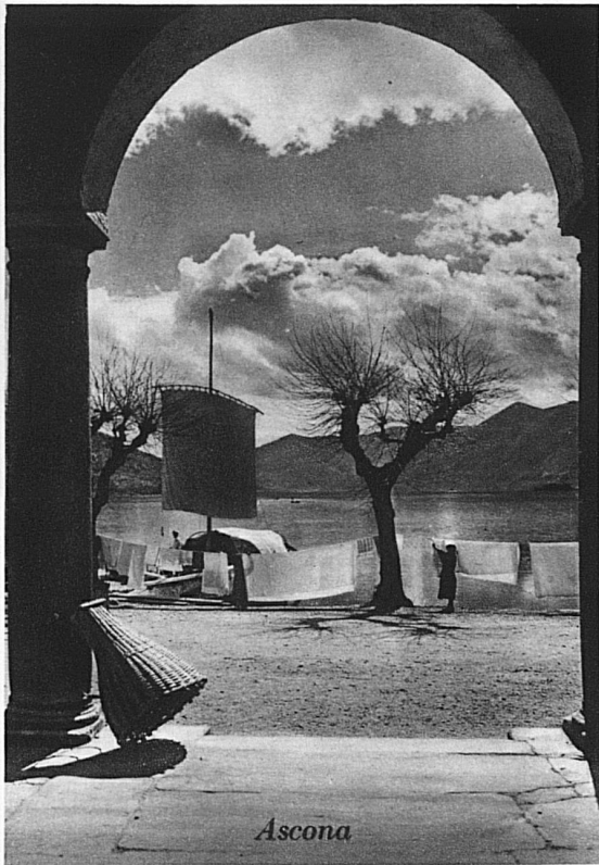
Ascona am Langensee / Ascona sur les bords du Lac Majeur / Ascona on Lake of Locarno / Ascona sul Lago Maggiore