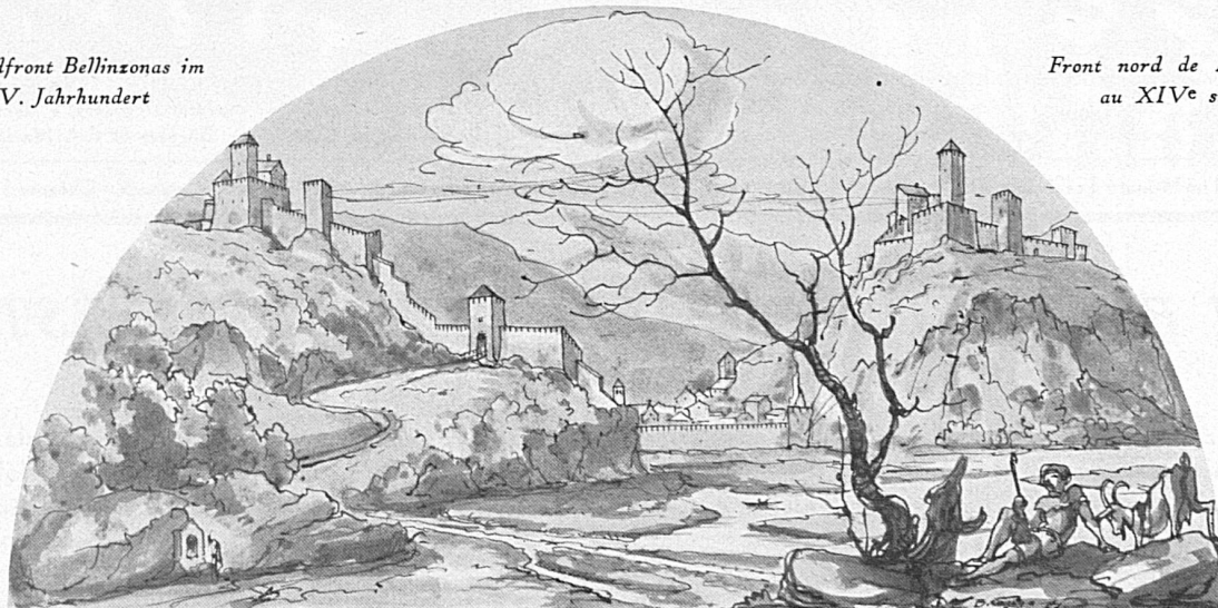
Front nord de Bellinzona au XIV e siècle

Michele entwachsen, beherrscht das romantische Bild. Neben dieser Burg erhebt sich das Castello Montebello, auch Castello di Svit (Schwyz) genannt, und hoch darüber am linksseitigen Felsenhang die kühnste der drei Festen, das massige, mit Ecktürmen bewehrte Castello Sasso Corbaro (Rabenstein). Man sieht das Tessintal gesperrt und abgeriegelt durch diese Befestigungsbauten und wird von aller Schönheit der malerischen Ansicht abgelenkt zu einer Vergangenheit hin, die durch die Kriegergestalten aus Hodlers Marignanofreske belebt ist.