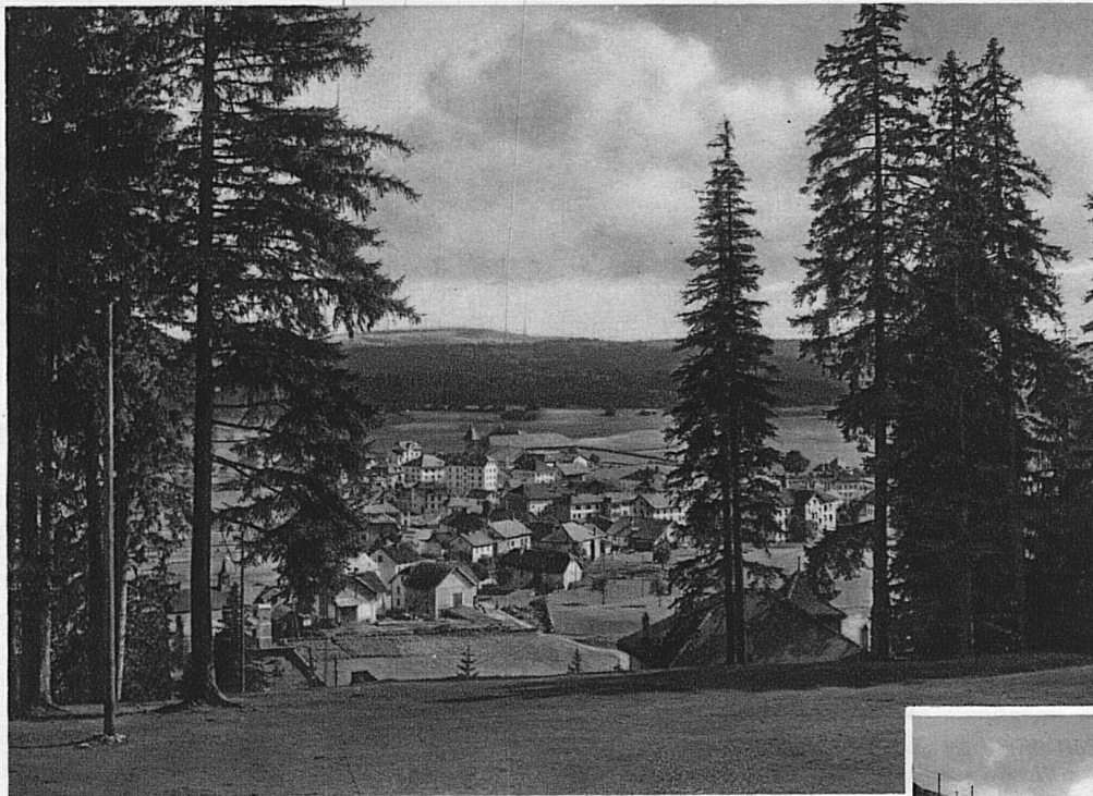
Blick auf Saignelégier Vue sur Saignelégier View to Saignelégier Vedutta su Saignelégier