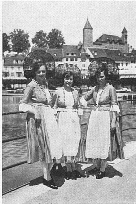
Phot. Wartenweiler Rapperswiler Rösli