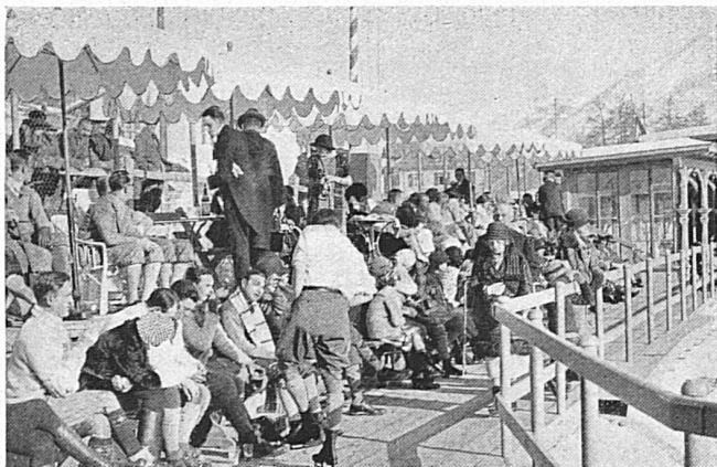
Auf den Zuschauertribünen in St. Moritz Les tribunes de St-Moritz