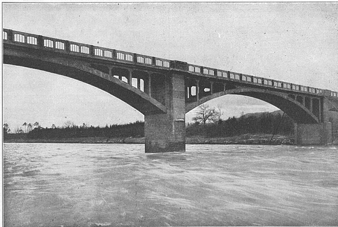
Strassenbrücke über die Thur bei Weinfelden

findet eine grosse Gartenbau-Ausstellung und landwirtschaftliche Produktschau statt, die vom Handelsgärtnerverband beider Basel, von den verschiedenen landwirtschaftlichen Organisationen der Nordwestschweiz