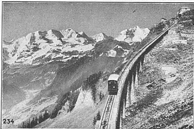
SEILBAHN NIESEN, Berner Oberland. Totale Länge 3496 m, überwundene Höhe 1645 m. Maximalsteigung 68 %

Walzwerke, Schmiede, Gießereien, Elektrostahlwerk, mech. Werkstätten