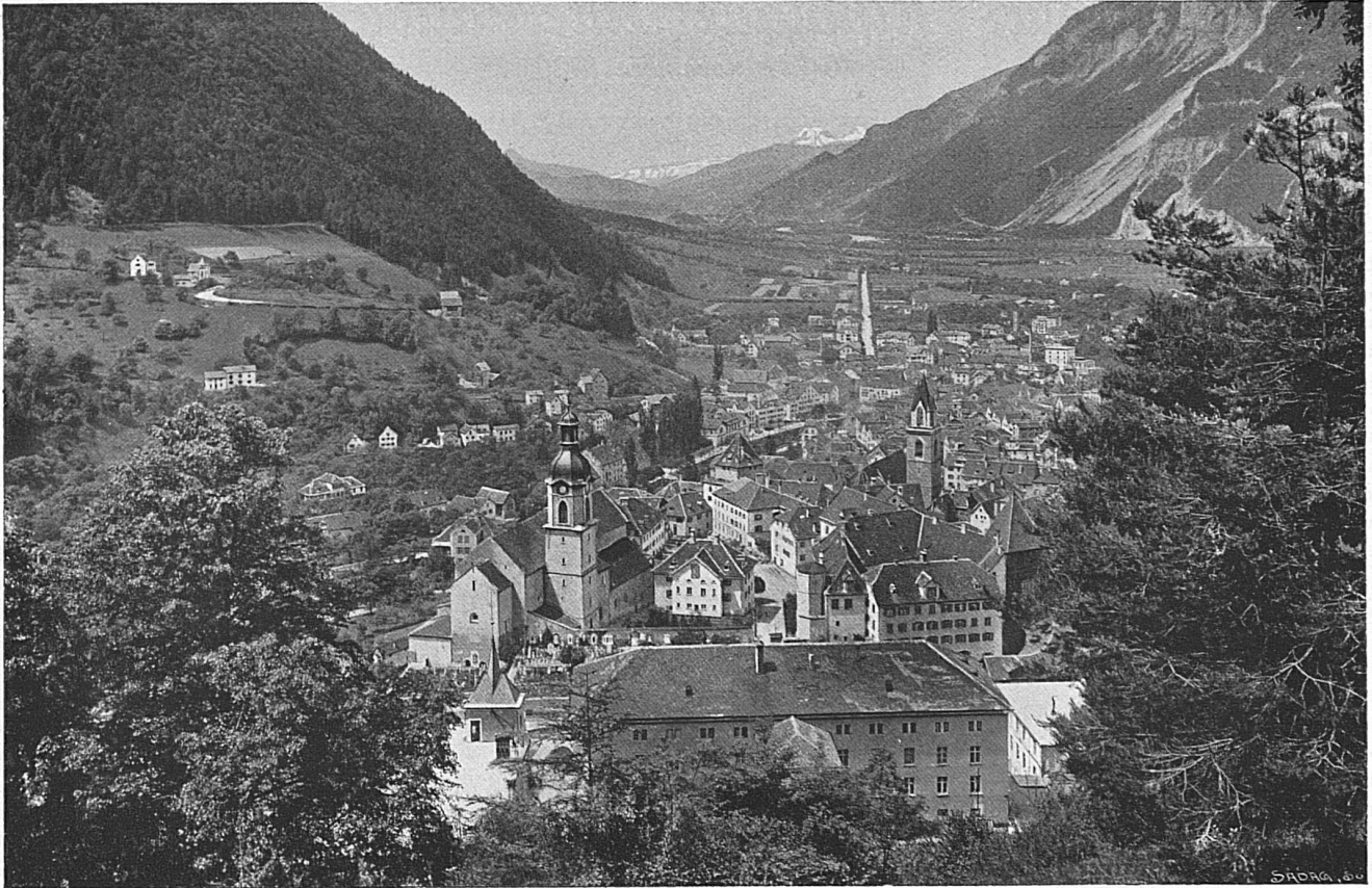
Chur, im Tal des Rheins / Coire, dans la vallée du Rhin