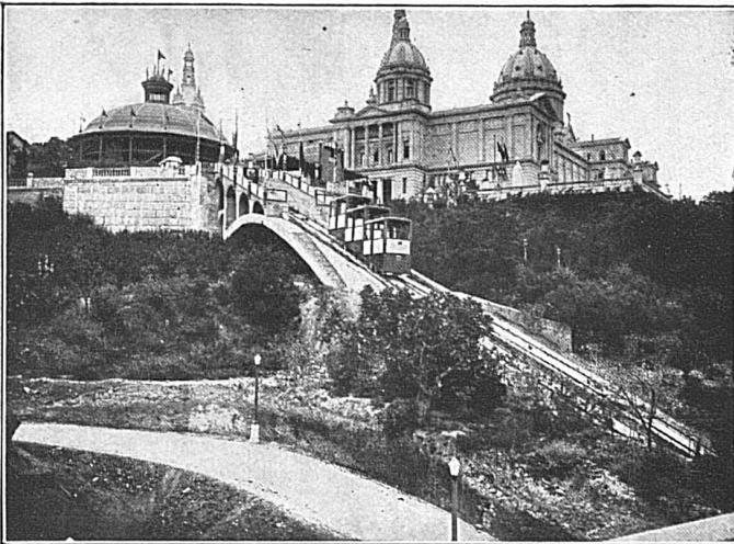
Drahtseilbahn beim Nationalpalast in der Internationalen Ausstellung in Barcelona, mit Wagen bis für 110 Personen

7° Gli ski e le slitte da sport, come pure gli skeleton ed i bobsleigh (questi ultimi solo in quanto il trasporto possa aver luogo senza inconvenienti col rispettivo treno) possono venir consegnati anche quali bagaglio registrato: è permesso al riguardo di spedire due o più paia di ski, o due e più slitte come un unico invio con un solo scontrino bagagli.