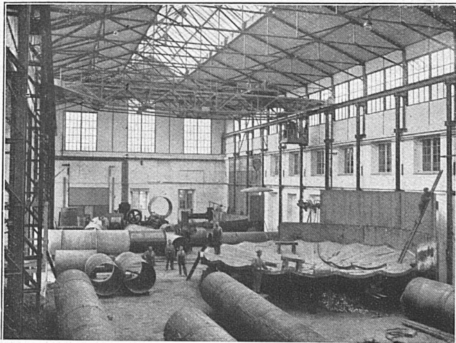
Unsere Kesselschmiede-Werkstatt Eiserne Baukonstruktion und Kranträger, erstellt 1923

Urnäsch. 25. Dezember bis 1. Januar: Skikurs im Gebiet Kräzerli-Schwägälp.