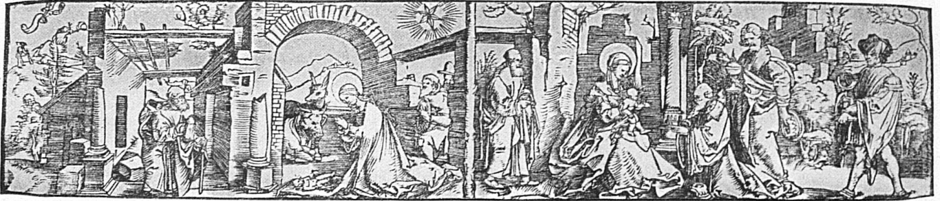
Hans Leu von Zürich. Nach Dürer 1520 Original im eidg. Kupferstichkabinett Zürich