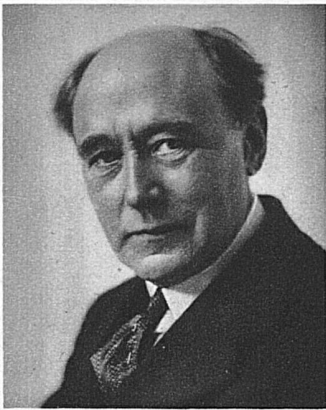
Dr. F. Weingartner