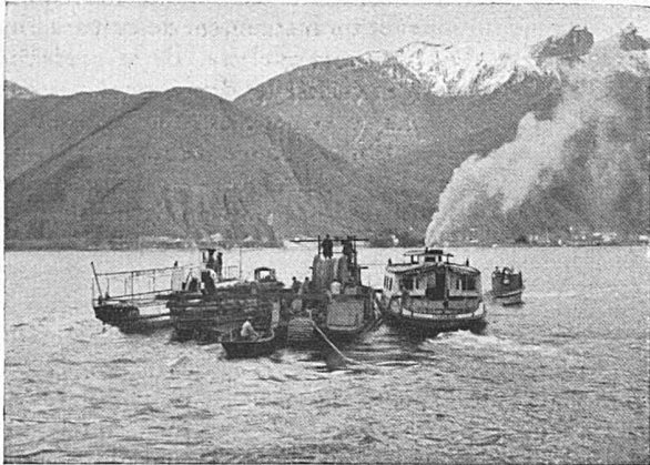
Abfahrt der Verlegeflotte in Poiana

Lieferanten von Starkstromkabeln (speziell Hochspannungskabeln) und von Schwachstromkabeln: Haupt- (Krarup-) und Nebenkabeln für die Elektrifizierung der Schweiz. Bundesbahnen