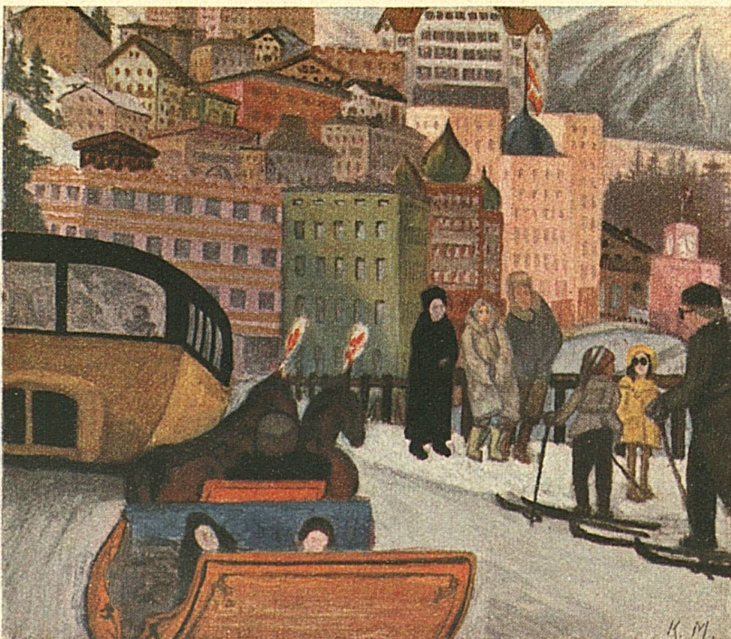
Eene wijk van St. Moritz in Zwitserland met schilderachtige en cosmopolitische architectuur, weerspiegelend de typische tegenstelling van den nog Italiaansch lijkenden hemel en het reeds noordelijke klimaat

Den volgenden dag begint natuurlijk een ieder met het voor hem het meest ongewone, het ski-en. Na den middag binden allen, en vooral wij Hollanders die nog steeds de ijssport onze nationale sport noemen, de schaatsen onder de voeten en gaan op de ijsbaan wat baantjerijden, of les in het kunstrijden nemen, of met hen, die het stevigst op de schaatsen staan, het snelle ijshockeyspel beoefenen. En zoo gaat het iederen dag verder, afgewisseld door bobrennen, sleetjevaren of skijöring (achter het paard), totdat men zich zoo sterk en gezond gevoelt, als een der krachtige in deze bergwereld geboren Zwitsers zelf. En het goede