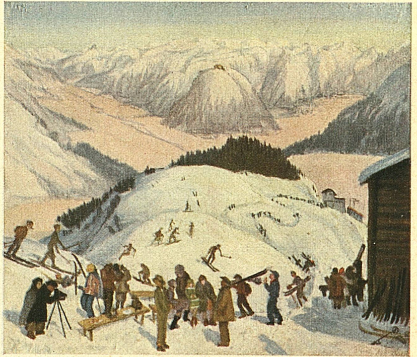
In den winter krioelen de Zwitsersche bergen als een mierenhoop van ontelbare toeristen, liefhebbers van ski, bobslee en schaatsenrijden

Het Eldorado van de wintersport is reeds zijn voorbereidselen begonnen, om ook in dezen winter zijn gasten uit alle landen der wereld te ontvangen. Zoodra de eerste sneeuw gevallen is, beginnen de wintersportplaatsen met hun voorbereidingen, opdat glinsterende ijsbanen, ijziggladde bobbanen, hier en daar ook een koene skeletonbaan, en dan natuurlijk ook de skisprongheuvels en de sledebanen, overal tijdig gereed zijn. Doch de wintersportplaatsen hebben nog meer voorzieningen te treffen: oefenmeesters in het schaatsenrijden en skilopen, danskunstenaars op het ijs en op het parket moeten in dienst worden genomen, geheel afgezien nog van de honderden andere hulptroepen, die het land, dat terecht op zijn uitnemende hotelwezen trotsch is, noodig heeft. Hotelorkesten trekken met viool en pauke naar het hooggebergte, reusachtige vrachtwagens voeren groote voorraden etenswaren voor de in de gezonde alpenlucht dubbel-hongerige sportmensen naar boven, en gaandeweg geraken al die stille berg-