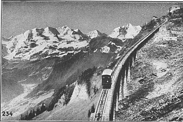
SEILBAHN NIESEN, Berner Oberland. Totale Länge 3496 m, überwundene Höhe 1645 m. Maximalsteigung 68%.

Walzwerke, Schmiede, Gießereien, Elektrostahlwerk, mech. Werkstätten