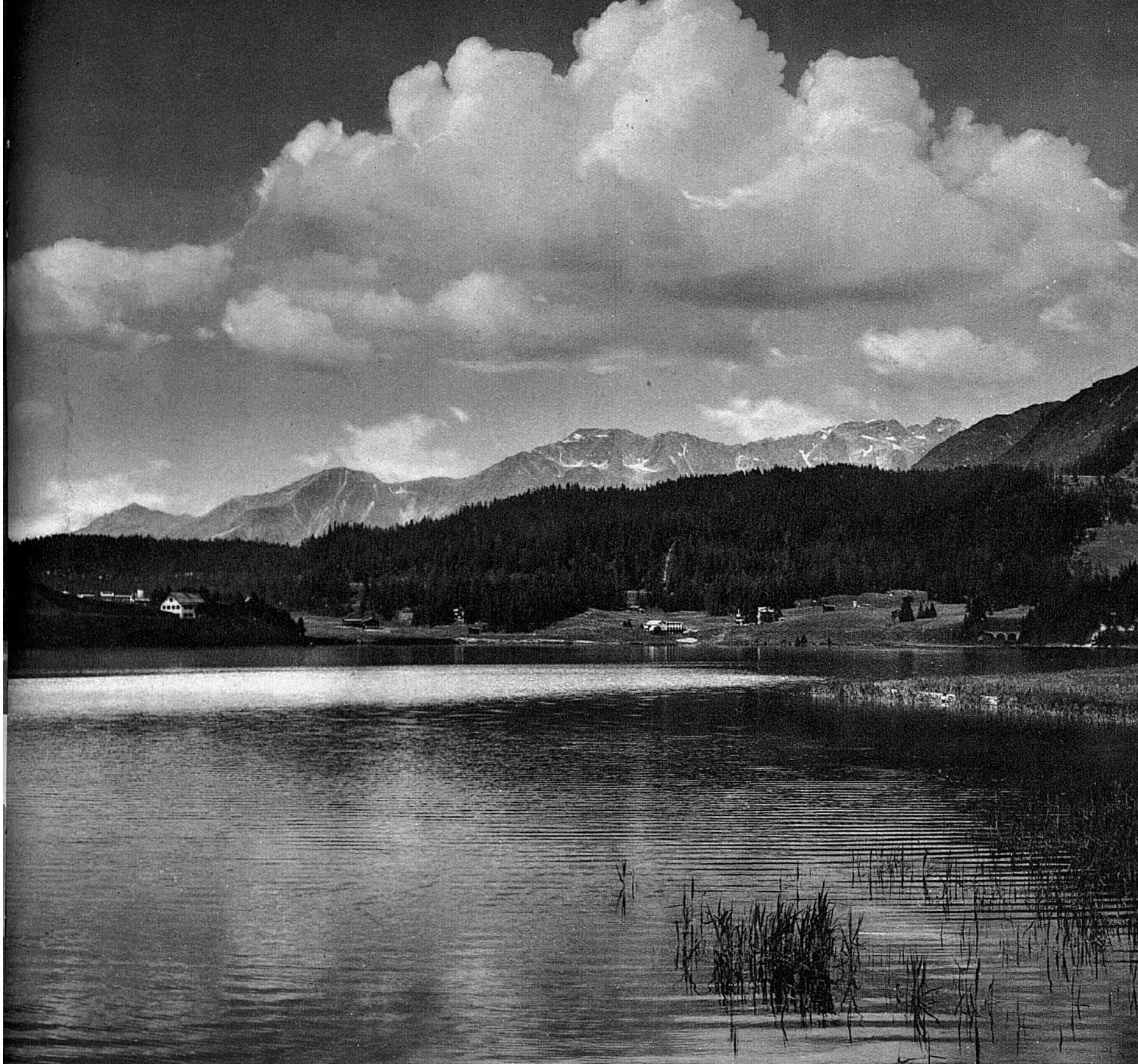
Der Davoser See