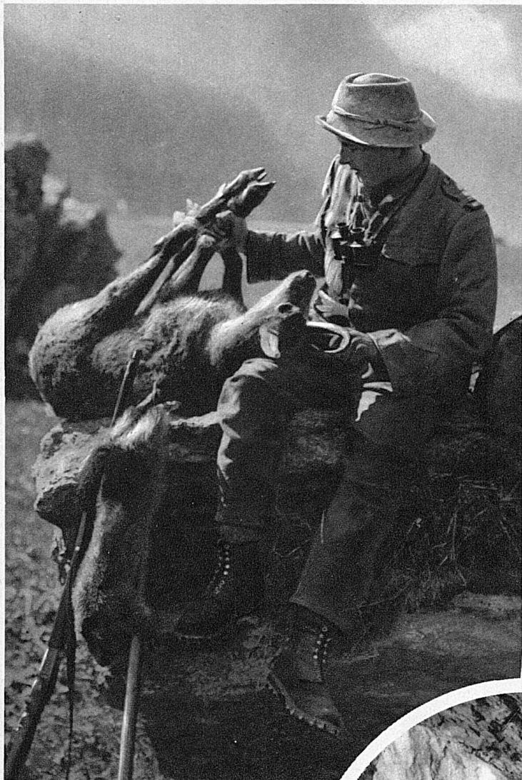
Jeune chasseur qui, pour son coup d'essai, a fait un coup de maître!

Déjà l'un d'eux s'avance près des grosses pierres, où les marmottes se terrent, muettes et craintives; il inspecte les tanières et s'approche, sans le savoir, à moins de cent mètres du chamois. Celui-ci est prêt à bondir, si l'intrus vient à démasquer une arme ou à prendre une certaine attitude. Le roi de l'alpe, à la vue de ce veston couleur de bure, de cette figure grisonnante, comme la sienne, se rappelle avoir déjà rencontré tout près de là, ce même chasseur, une même