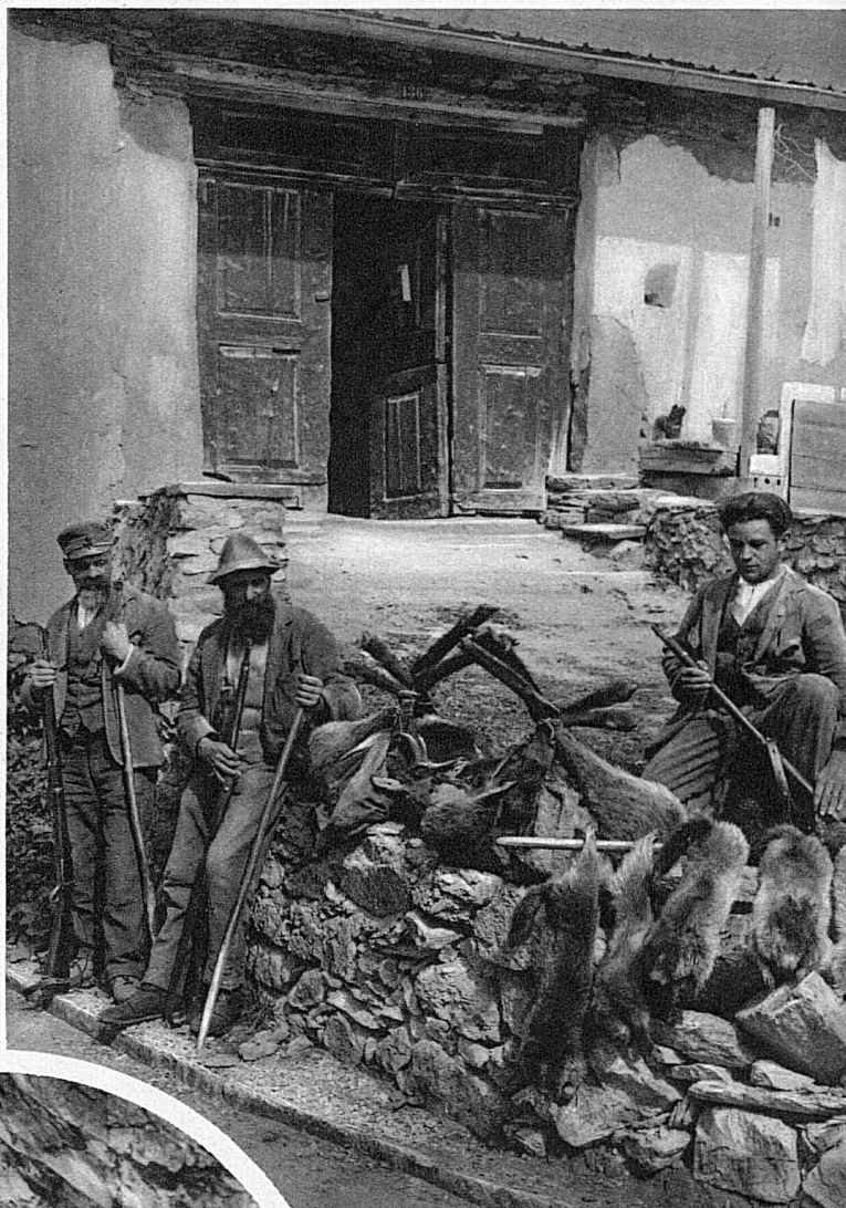
Chasseurs grisons contemplant avec fierté le riche butin qu'ils ramènent de leur randonnée.