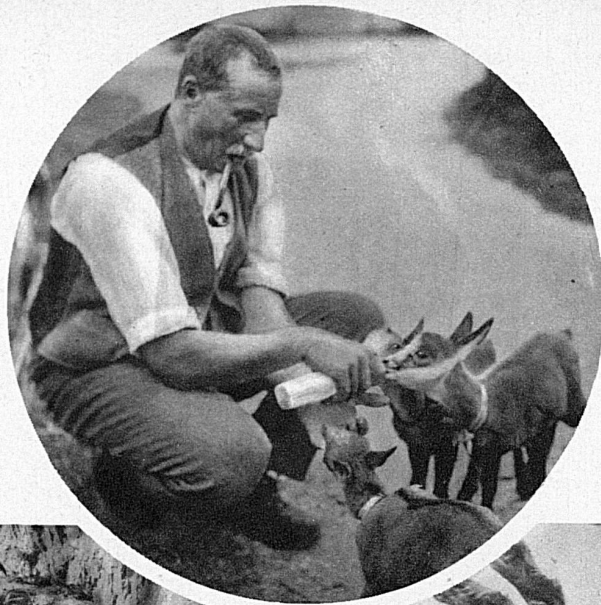
Petits chamois capturés dans les Alpes glaronnaises et élevés au biberon jusqu'à leur transfert dans un parc.