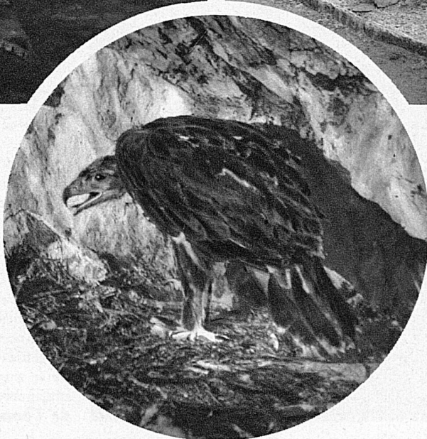
Un aigle impérial âgé de six semaines surpris dans les Alpes glaronnaises.