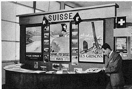
Unsere Auskunftsstelle an der Exposition Coloniale in Paris.