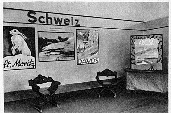
Rechts: Die Schweiz an der Leipziger Herbstmesse.