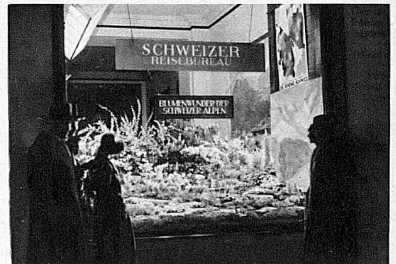
Rechts: Ein Alpengarten im Schaufenster der SBB-Agentur Unter den Linden in Berlin.