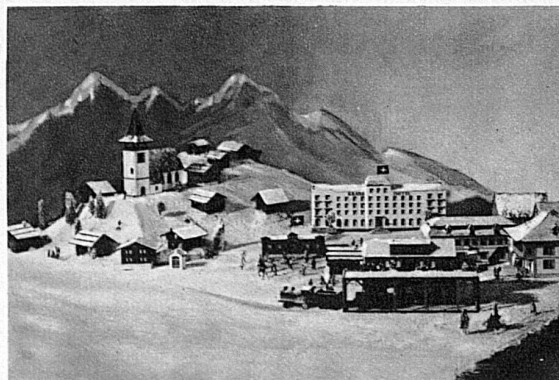
„Bergwinter“ im Stand der SBB an der Leipziger Herbstmesse.