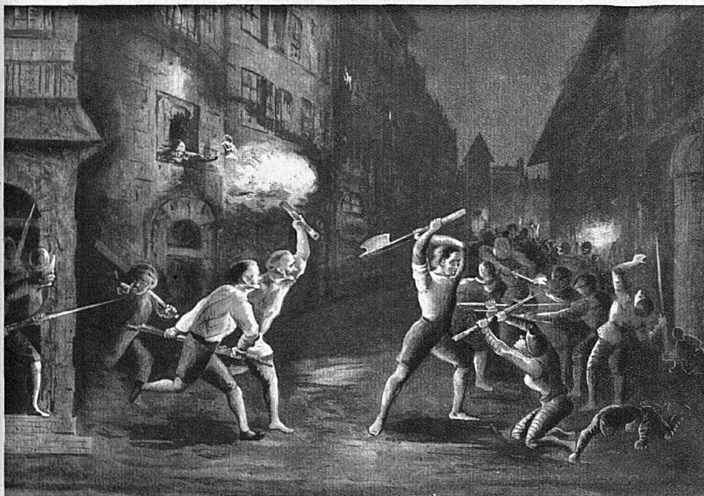
Jählings aus dem Schlafe geweckt, eilen die Genfer Bürger auf die Strasse, wo ein wütender Kampf entbrannt ist.

Nach einem dem taubstummen Miniaturmaler und Graveur François Diodati von Genf (1647—1690) zugeschriebenen Kupferstich.