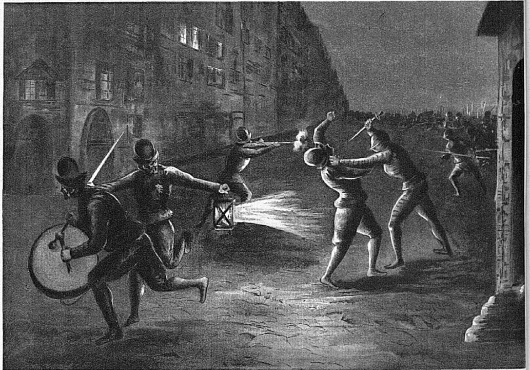
Wachtmeister Boussezel, der Führer der Ronde, der die Eindringlinge bemerkt und angerufen hatte, wird von Brunaulieu erstochen. Laternenträger und Tambour eilen zur Porte de la Monnaie und alarmieren die Wache.