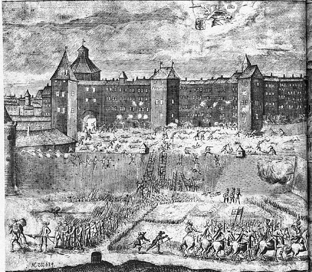
Ganz links im Bilde die Porte de la Monnaie, der Turm rechts davon ist die Corratierie; in der Mitte die Porte de la Tertasse, davor die Oie-Schanze; ganz rechts das Neue Tor und zu äusserst rechts das Rathaus. Das Bild stellt alle Phasen der Escalade gleichzeitig dar: Besammlung der Savoyer in Plainpalais, Er-

VRAIE REPRESENTATION DE L'ESCALADE ENTREPRISE SVR GENEVE PAR