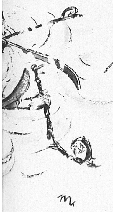
Dessin de Busch, Böck et Macon