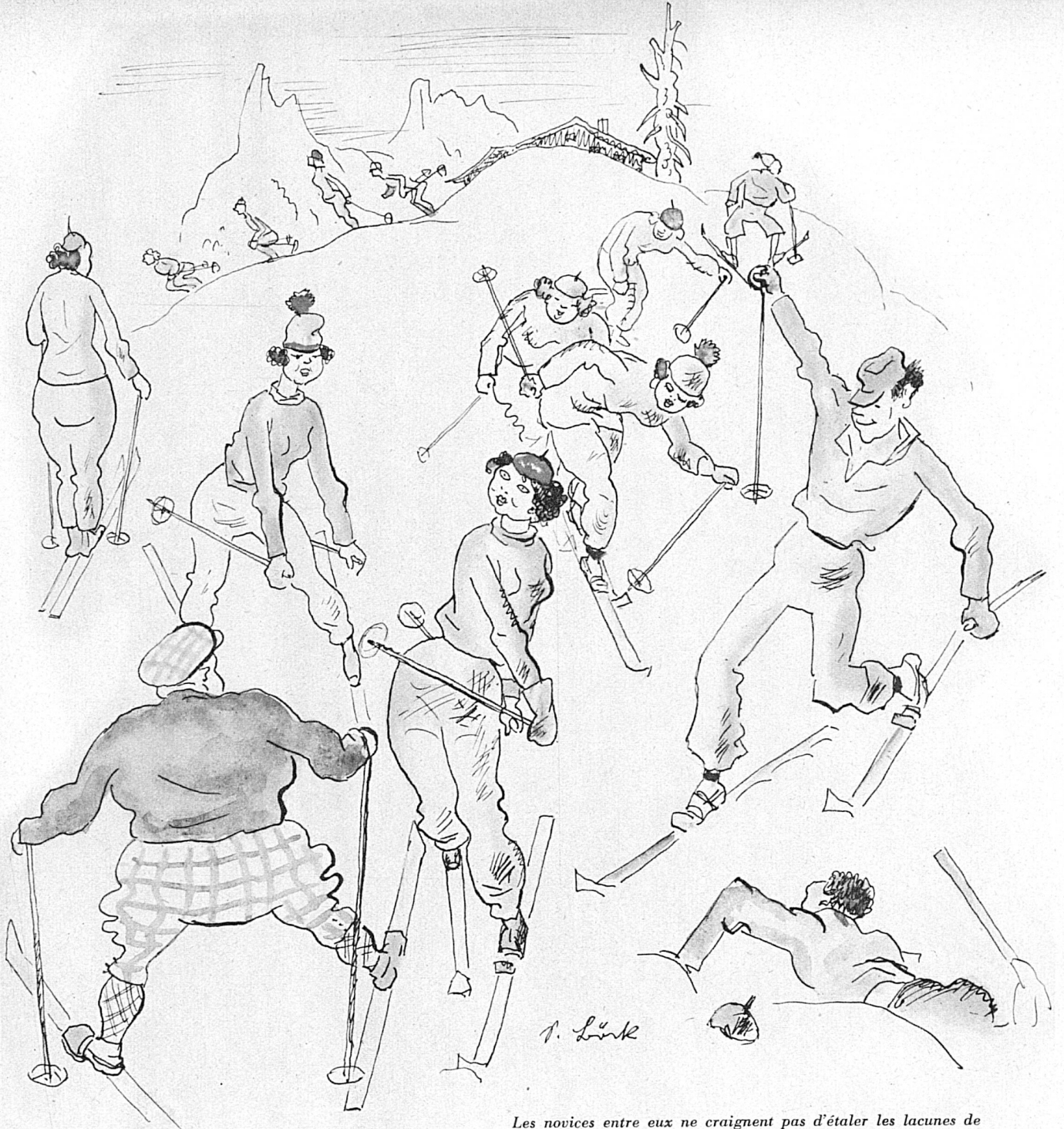
Les novices entre eux ne craignent pas d'étaler les lacunes de leur art