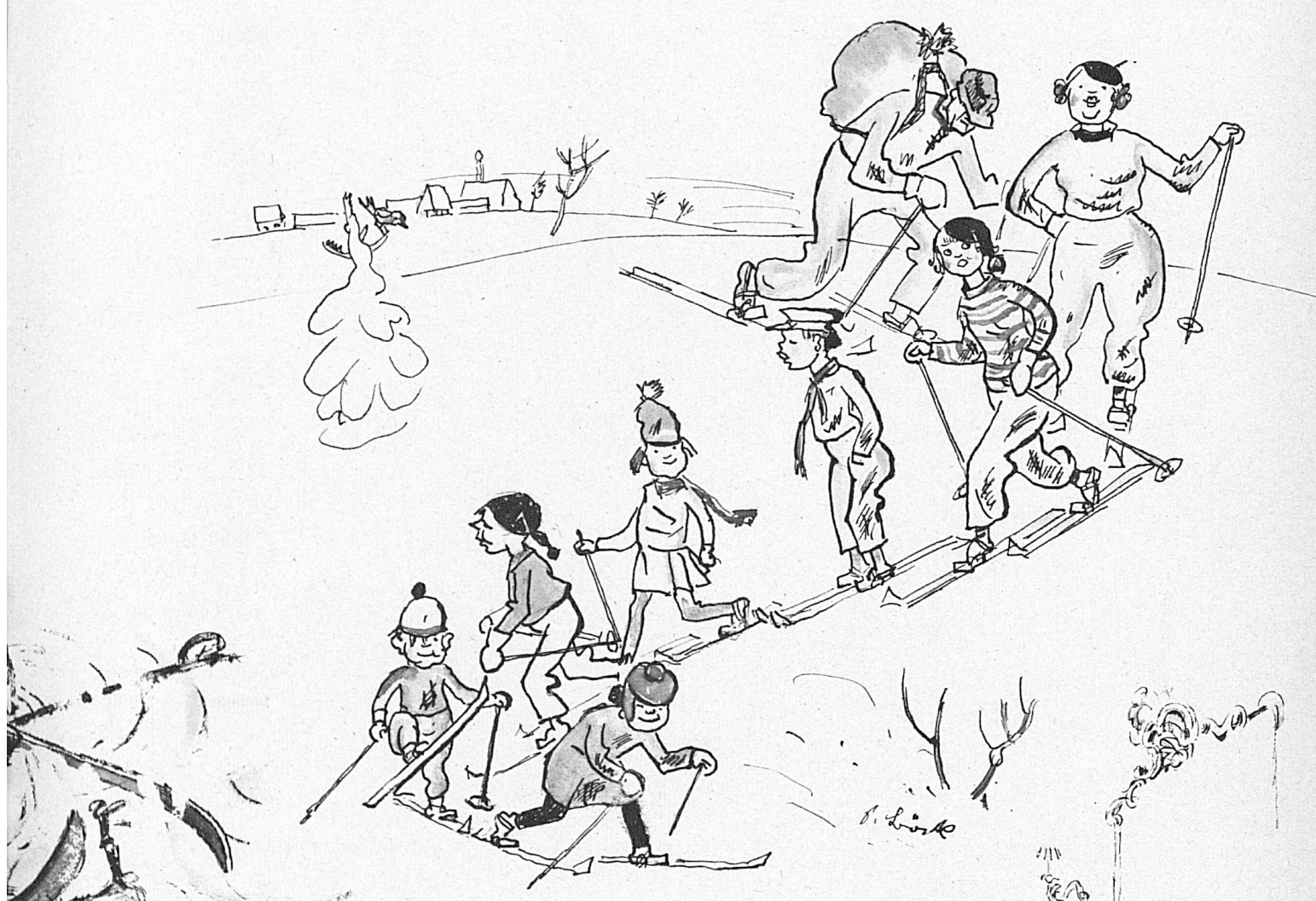
Les beaux dimanches: La famille prend le départ par ordre hiérarchique