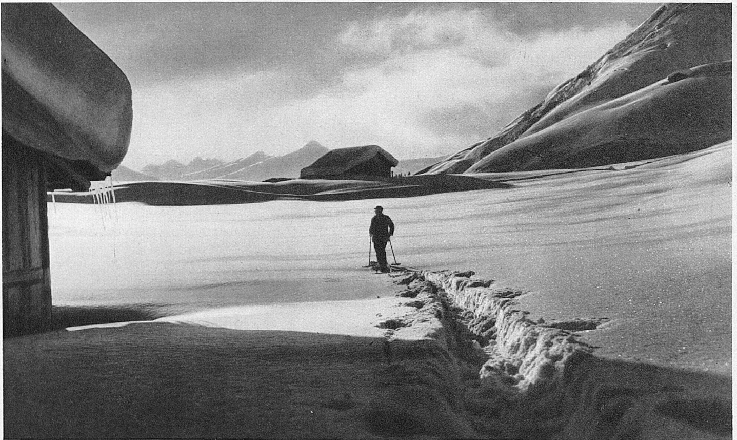
Die erste Spur im glitzernden Neuschnee bei Grindelwald