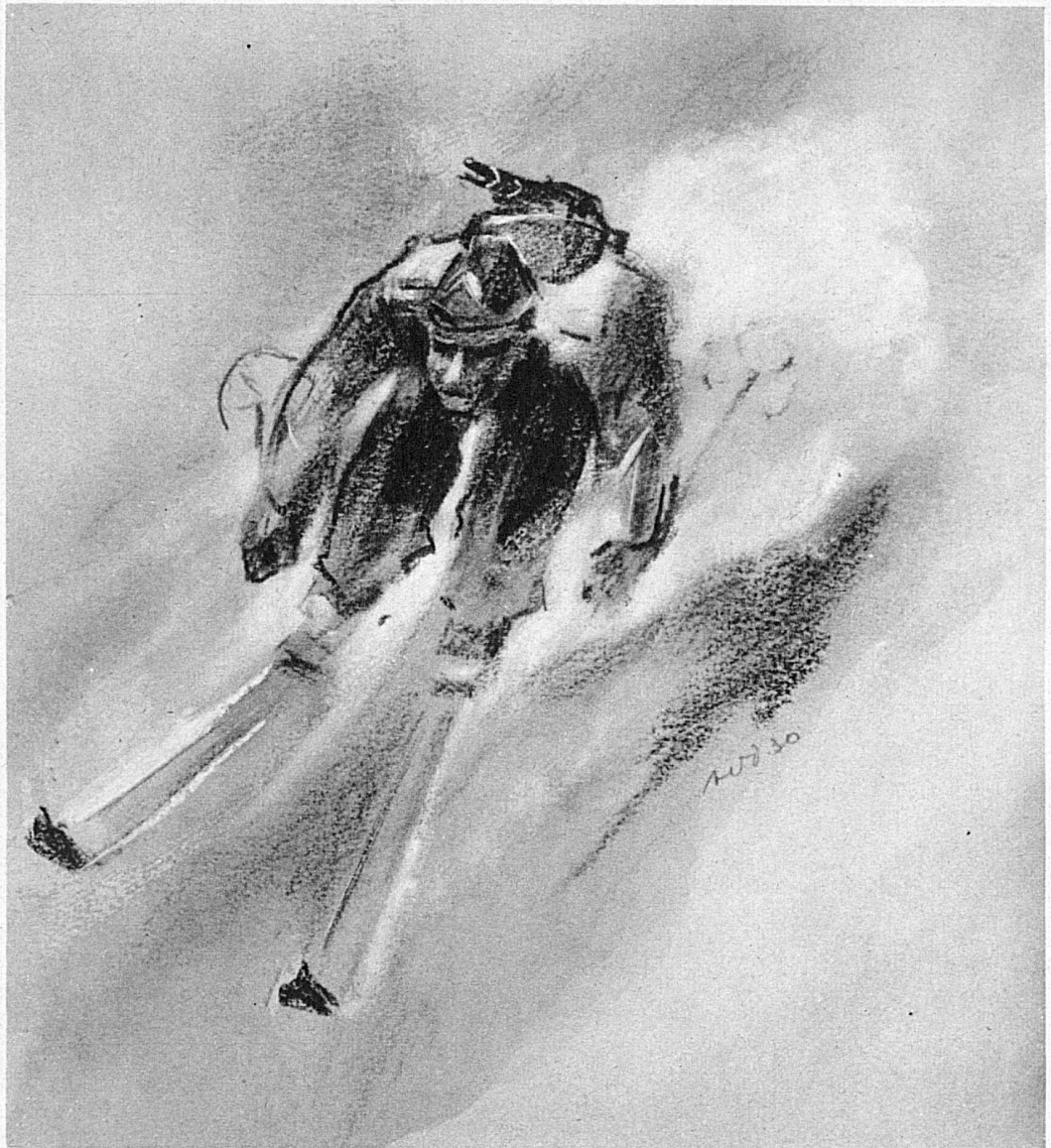
Damit gibt er das Zeichen zu einer wahnwitzigen Jagd

— auf Harsch folgt wieder Pulver. Furchtbarer Massensturz, schauderhafter Wirrwarr von Körpern, Beinen, Skiern, Karabinern, Stöcken, Packungen. Zum Glück sind alle heil. Weiter geht die Hetzjagd. Steile Mulden und langgestreckte Gletscherböden — alles rasseln wir in vollem Tempo ab. Schon sind wir über die Gletschermitte hinaus. Allmählich steuern wir etwas nach links, dem riesigen Seitenmoränenwall zu. Bald schliessen wir dicht zusammen, wechseln auch mal ab in der Führung und finden Musse, über den guten bisherigen Verlauf der Fahrt ein paar Worte auszutauschen. Eine langgestreckte, steile Runse am linken Gletscherufer zwischen der Moräne und einem lawinendrohenden, hohen Hang von beängstigender Glätte und Steilheit entfacht einen halsbrecherischen Finish. Ein rückhaltloses Freudengefühl lässt die hier lauende Staublawinengefahr nicht aufkommen. Wir erreichen das Gletscherende und schicken uns an, einen langen, flachen Talboden zu durchheilen. Auch hier drohen La-