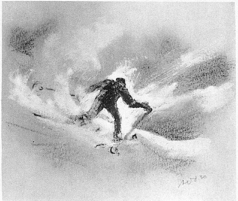
Ein erster Schuss bringt mich an den Plateaurand