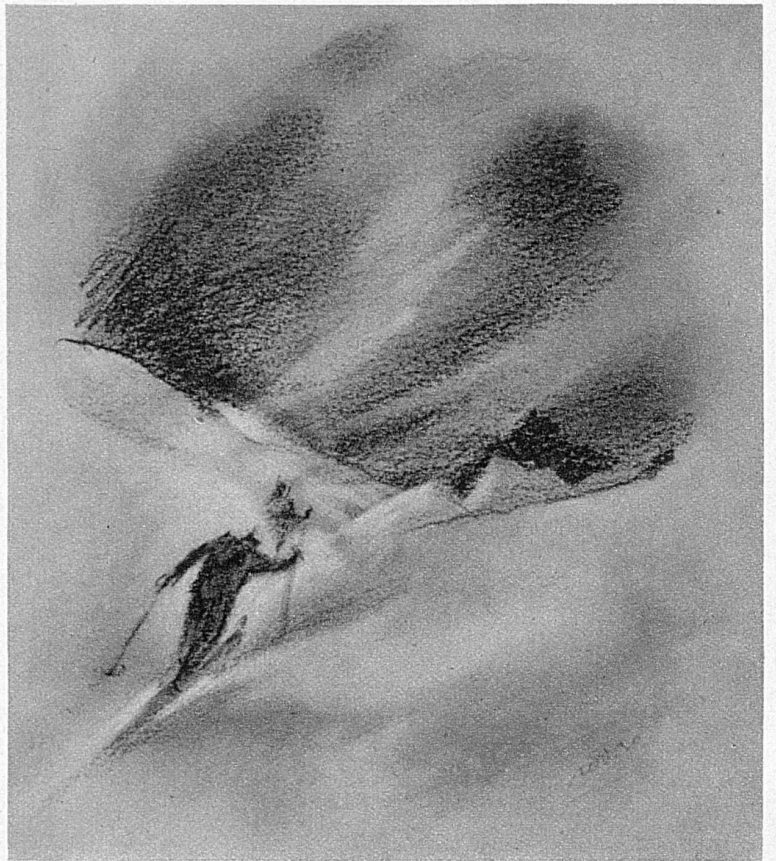
Weiter geht die Hetzjagd

den Wind gestemmt, vor mir aufpflanzt, behandle ich rasch die blitzenden Laufflächen mit etwas durch die Körperwärme in der Hosentasche vorgewärmtem Mix. Fertig — los! Mehr als drei Minuten haben wir nicht eingeblüht. Im Sturmgebraus und Schneetreiben scheinen die Kameraden unser Zurückbleiben nicht bemerkt zu haben. Hallo! Anhalten! Umsonst. Was soll eine Menschenstimme in diesem Höllenkonzert der entfesselten Naturkräfte? Aber wir müssen wieder zusammenschliessen, damit wir's besser schaffen. Die nächste Viertelstunde wird zur härtesten Prüfung während meiner ganzen sportlichen Laufbahn. Die Pulse hämmern zum Zerspringen, die Augen schmerzen fürchterlich. Nur hundert Meter vor uns kämpfen die andern zwei. Von einer Spur ist keine Rede mehr. So wütet der Sturm auf dem Firn. Oft brechen wir mit der trügerischen Kruste durch und ersaufen fast im mehligem Pulver. Einen Moment lang will mich das klare Bewusstsein verlassen — aber mit aller Energie überwinde ich die Krisis. Nur jetzt nicht zurückbleiben, sage ich mir, sonst ist's aus. Einige hundert Meter unter der Lücke ist die Patrouille wieder geschlossen. Was es kostete, aufzuholen, streifte die Grenzen menschlicher Leistungsfähigkeit.