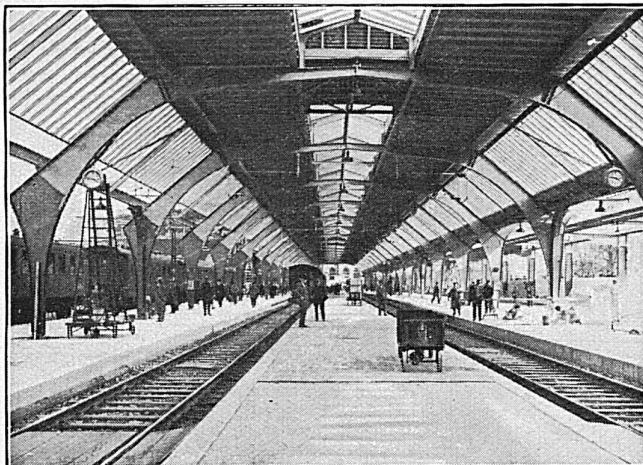
Perronhalle 1 im Hauptbahnhof Zürich Projekt und Teilausführung durch die A.G. Theodor Bell & Co., Kriens

Publié par la Direction générale des chemins de fer fédéraux. Rédaction: Secrétariat général à Berne / Annonces, Impression et Expédition: Buehler & C ie , Marienstrasse 8, Berne / Paraît une fois par mois / Abonnement: 1 année fr. 10.—, 1 N o fr. 1.— / Chèques postaux III 5688