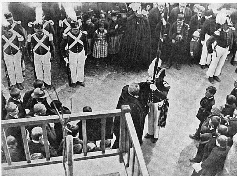
Remise du drapeau

Kuehmatt près de Blatten; à l'arrière-plan le Langgletscher