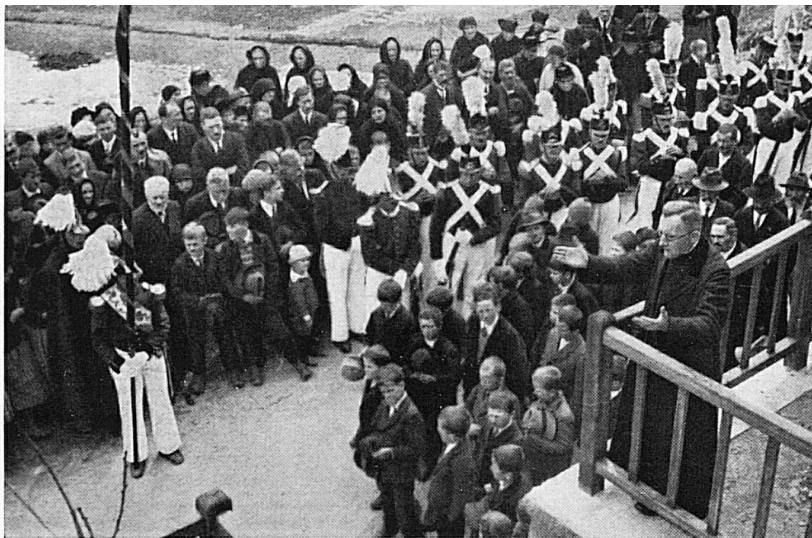
Pendant le discours du prieur