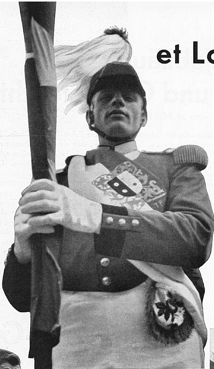
Le nouveau porte-drapeau du Loetschental

Au-dessous: Visages ridés et songeurs de paysans