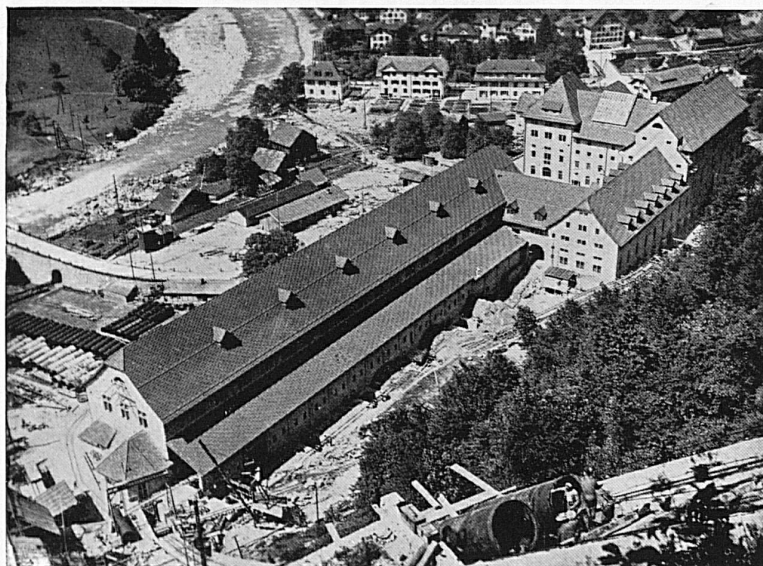
ZENTRALE DES KRAFTWERKES AMSTEG DER SBB