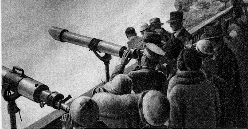
Sur la terrasse du Berghaus au Jungfraujoch; les impressions qu'on y éprouve s'impriment dans l'âme en caractères ineffaçables. Devant tant de grandeur et de beauté, le touriste se fait humble.

servatoire, qui verra accourir les savants de tous les pays, spécialement les géologues, les météorologues et les astronomes. Où pourrait-on mieux observer les couches terrestres qu'à 4000 m. d'altitude? Et n'est-ce pas sur les montagnes, où les sommets sont en perpétuel conflit avec les nuages, qu'on peut le mieux se rendre compte des phénomènes météo-