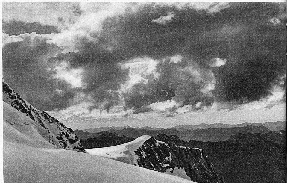
Le soir au Jungfrauoch; tout autour, à perte de vue, les sommets innombrables des Alpes ont l'air d'une mer en furie dont les vagues auraient été soudain pétrifiées.

Le Jungfrauoch est un des points célèbres du globe. On veut y avoir été au moins une fois dans sa vie, comme à Changhaï, Tombouctou, Buenos-Ayres ou Naples. Pourquoi? Parce que le Jungfrauoch est un endroit unique au monde, pour employer une expression fort banale, mais parfaitement à sa place ici. Voyez: Partout ailleurs, à cette altitude de 3457 m., on ne rencontre que la nature sauvage et hostile, ou alors de pauvres cabanes désertes. Le Jungfrauoch est seul à vous offrir, au milieu des glaces, un hôtel avec des salles chauffées, des repas servis, de bons lits blancs comme à la maison. C'est un morceau de civilisation, transporté miraculeusement au milieu des neiges éternelles. Et l'on sait ce que représente pour le touriste épuisé l'accueil d'un poêle chaud autour duquel s'empres- sent des visages souriants, pour vous servir le potage, le bifteck, le dessert, le café noir et le cigare. Cette demeure hospitalière est tendrement assise sur l'épaule blanche de la Jungfrau, majestueuse reine des