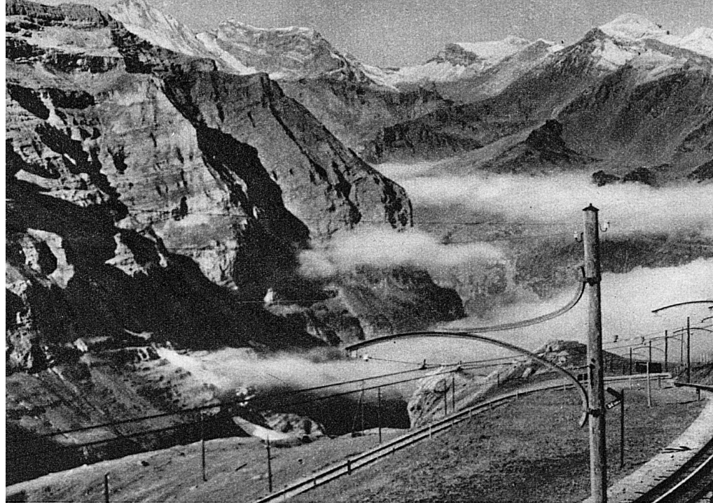
chemin de fer de la Jungfrau est sans aucun doute un des plus hardis et des plus beaux du monde.

Alpes. Et puis, pour y accéder, il n'est pas nécessaire d'être un glorieux alpiniste armé de cordes et de piolets, risquant sa vie dans l'ascension. Le plus frêle d'entre nous n'a qu'à s'asseoir dans une des voitures du chemin de fer de la Jungfrau pour être transporté à près de 4000 m. et y goûter les joies sublimes de la haute montagne. Le Jungfrauoch a