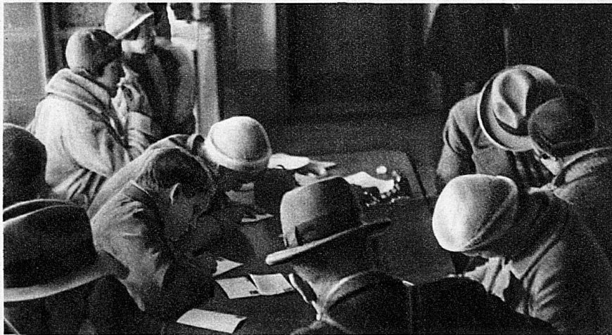
Mais on n'est pas égoïste au point de garder pour soi les joies de la haute montagne. Il faut en faire part aux amis restés dans la plaine.

servatoire, qui verra accourir les savants de tous les pays, spécialement les géologues, les météorologues et les astronomes. Où pourrait-on mieux observer les couches terrestres qu'à 4000 m. d'altitude? Et n'est-ce pas sur les montagnes, où les sommets sont en perpétuel conflit avec les nuages, qu'on peut le mieux se rendre compte des phénomènes météo-