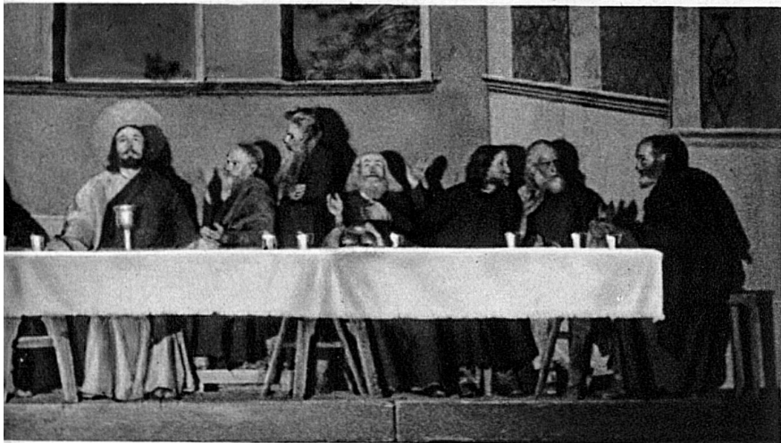
Le suprême Repas, dont le souvenir ouvre chaque jour à des millions d'âmes l'espoir du Banquet éternel.