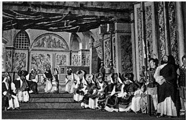
Caïphe, qui tient sa Proie, interroge haineusement le Fils de l'homme.

Honneur à ces paysans, qui songent aux légendes divines de l'éternité. Rendons grâce à ces évocateurs, humblement émouvants, d'un monde ou palpitent et communient, dans un même élan du cœur le sublime et la simplicité. Oui, il faut avoir vu Selzach, tout pantelant d'un rêve mystique éperdu, associant jeunes et vieux, riches et pauvres, vieillards, hommes, femmes et enfants, à la vivante célébration du Mystère qui, depuis vingt siècles, hante et soulève d'espoir notre monde occidental. P. Bise.