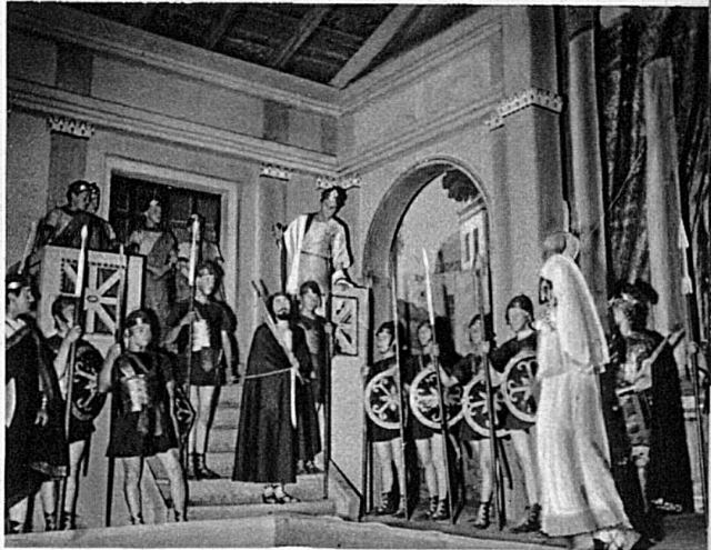
Le Procurateur de Judée pose d'ultimes questions au divin Sacri