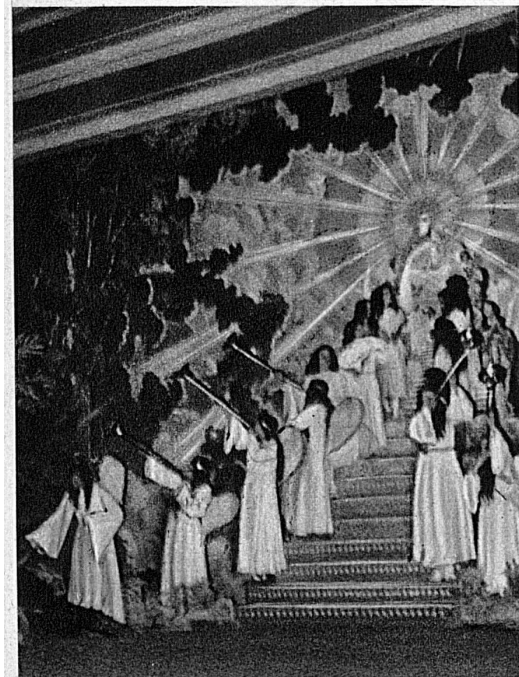
Dans un éblouissement de lumière, l'esprit de Jacob assoupi gravit avec les anges diaphanes le céleste escalier.