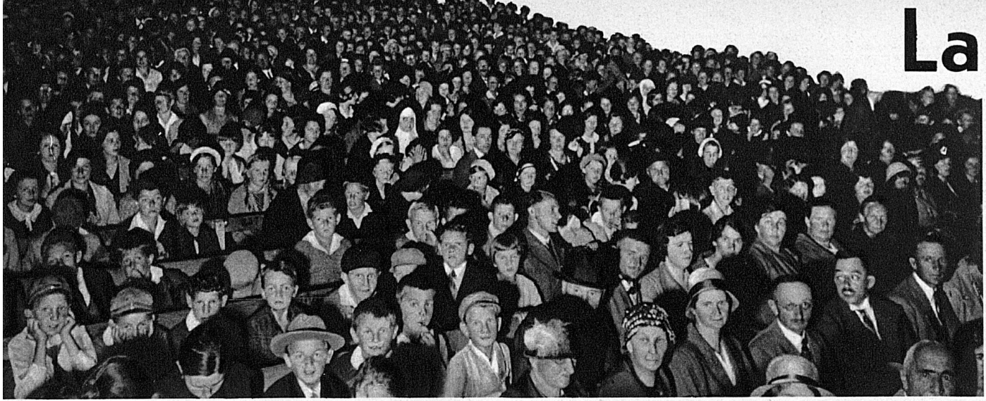
Les foules accourent ici, comme autrefois dans les champs galiléens, pour entendre la Parole qui enivre les cœurs...