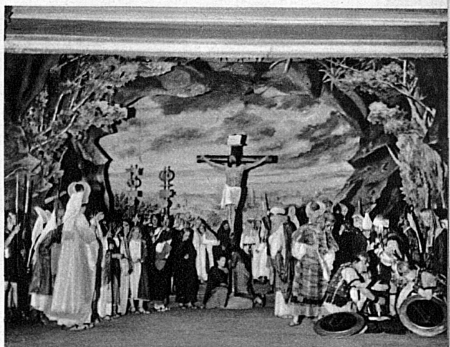
L'holocauste tragique, l'apothéose de la Mort, et sa défaite.

Dessous, à droite: Ceux qui se mueront tout-à-l'heure en apôtres de la nouvelle Alliance.