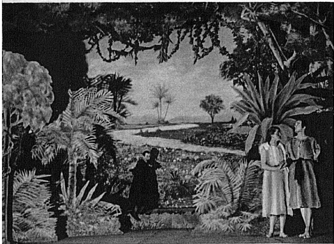
Dans la splendeur des premiers matins, accablés sous le poids de leur faute, Adam et Eve, qu'épie l'éternel Tentateur...