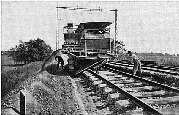
Machine à dégarnir et cribler le ballast des voies de chemins de fer