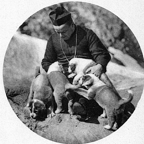
Mais les pères de l'hospice continuent à faire l'élevage de ces admirables sauveteurs pour leur valeur historique et les services qu'ils peuvent rendre ailleurs, en raison de leur bonté native, de leur puissance et surtout de leur inégalable flair