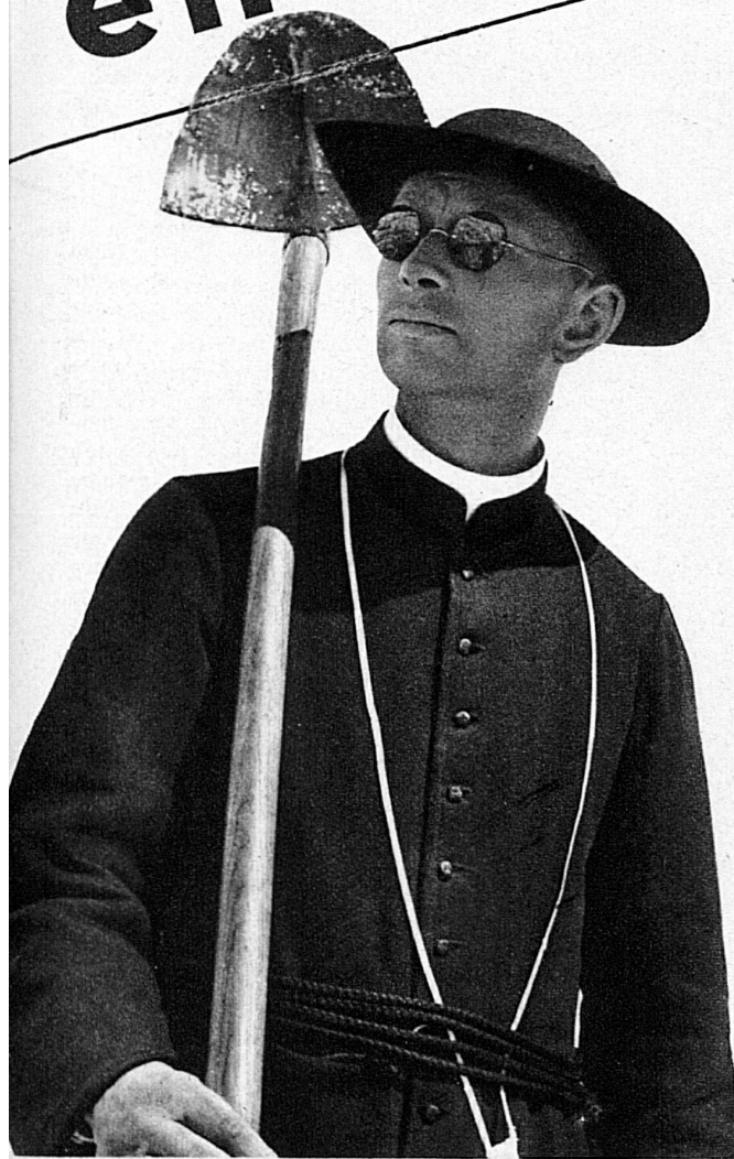
Fidèles aux origines de leur institution et à leurs traditions séculaires, les moines du Grand Saint-Bernard s'occupent du sort des voyageurs, refont pour eux sans se laisser la route qui leur permettra d'atteindre l'hospice

le chemin tombe à pic dans l'abîme, et l'appareil magique le précède. Les arbres qui le bordent avec sérénité redoutent un cataclysme. Ils rapprochent leurs têtes vertes, se concertent devant le phénomène. Les voilà pris d'effroi. Ils se sauvent, se dispersent, regagnent à tâtons leur place séculaire, se penchent tumultueusement sur mon passage et, répercutant dans leurs millions de feuilles la joie presque insensée de la force qui chante, murmurent à mes oreilles les psaumes volubiles de l'Espace.