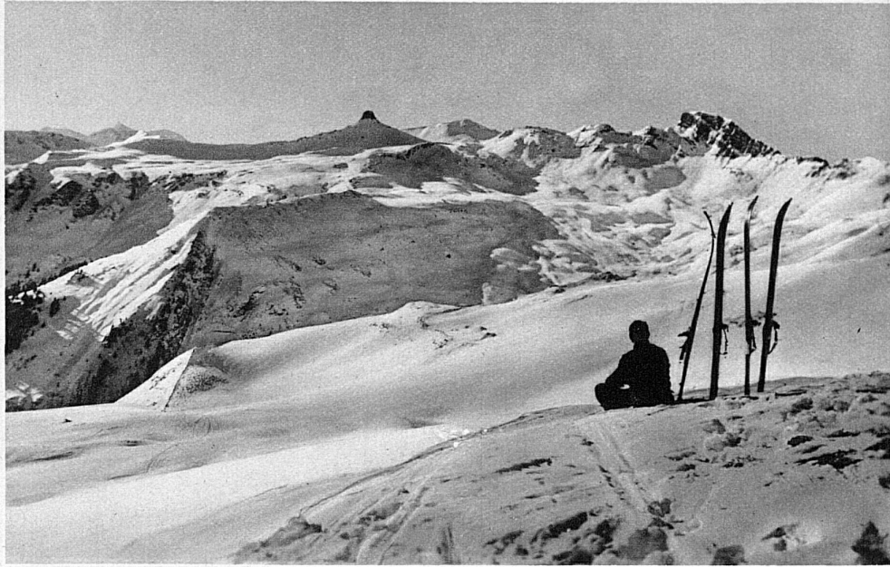
Maskenkammlücke in den Flumserbergen

Die verhältnismässig tiefgelegene Ost- und Zentralschweiz ist nicht so königlich mit Schnee gesegnet wie Graubünden, Berner Oberland und Wallis. Begreiflich: es kann nicht allerorten Überfluss herrschen! Die fahrbare Decke kommt in diesen tiefern Lagen leider oft um Wochen zu spät, ist vom Föhn über Nacht spielend wegzubringen und apert im Lenz schon zeitig wieder aus. Krokusse, Primeln und junges Mattengrün brechen allerorten auf, dieweil in den alpin gelegenen Kurorttälern es erst zu köstlichem Sulzschnee taut.