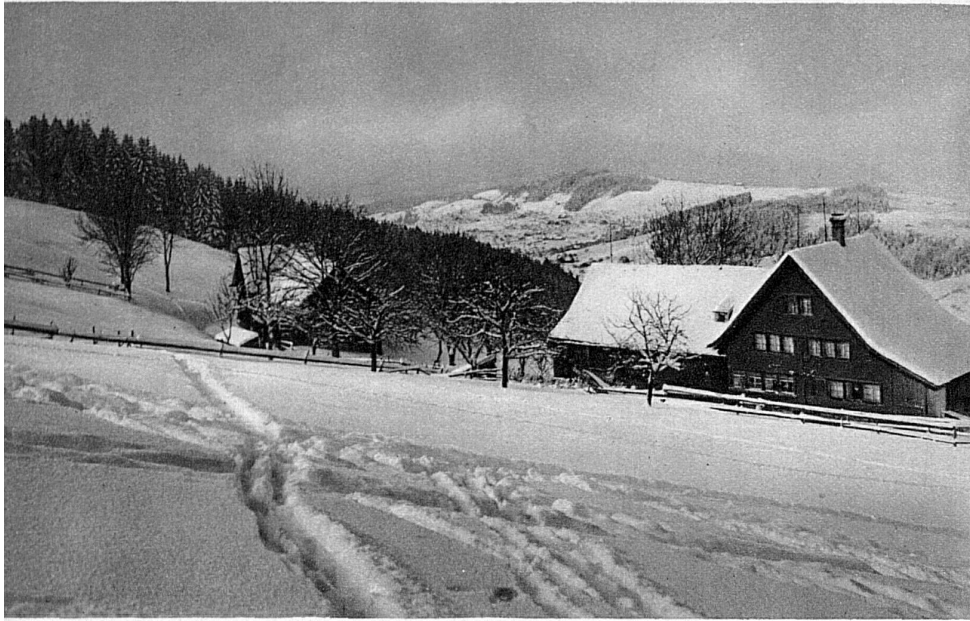
Kaien im Kanton Appenzell

in der Schweiz und ist uneingeschränkt die weitaus schönste Skiabfahrt der Ostschweiz, eine reine Nordhangsache mit guten Verhältnissen bis in den April hinein. Die steilragende Pyramide des Schilt ist der touristische Übergang zum Glarnerland. Schon ernsthafter in die Hochalpen hineingeschoben liegt über stotziger Berglehne die sonnige Braunwaldterrasse. Lohnend sind Besuche im Planura- und Ortstock-Skihaus (Tödigebiet, Gemsfayren, Clariden).