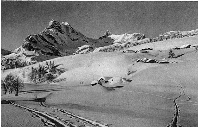
Braunwald mit Ortstock

Die Urschweiz, rund um die Mythen herum, mit Einsiedeln als sportliches Zentrum, rückt mit prächtigen Skigeländen auf. Da wären Oberiberg, die Ibergereg, das Hochstuckli und die Hesisbohlalpen. Ein weitgespanntes Gebiet mit vielen und guten Unterkünften. Die Stooss-Terrasse am Nordhang der Vierwaldstätter-Frohnalpkette hat ausgedehnte