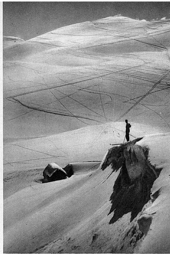
Hesisbohlalpen im Kanton Schwyz

Touren zum Frohnalpstock, zu Kaiser-, Klingen- und Hauserstock.