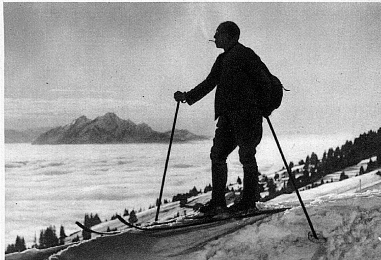
Auf dem Rigi