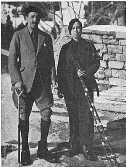
Hohe Gäste zur Winterkur in Mürren.