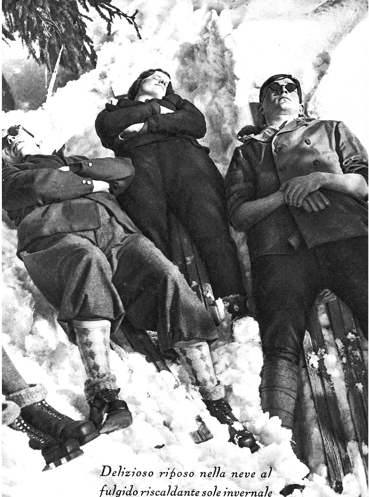
Delizioso riposo nella neve al fulgido riscaldante sole invernale