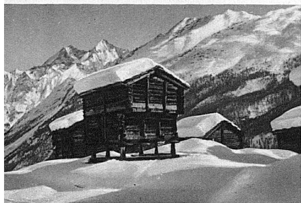
Magnifiques champs de neige près de Zermatt

En bas: Gornergrat, Monte Rosa et le groupe de Castor et Pollux vus du Lac Noir